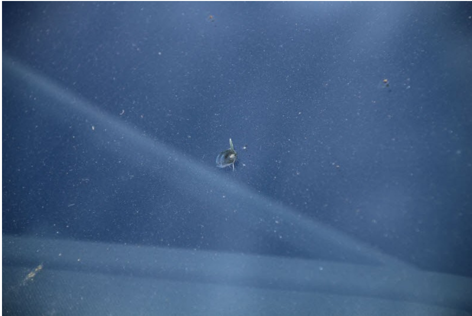
Bild 15 Windschutzscheibe Steinschlag mit Sprung.