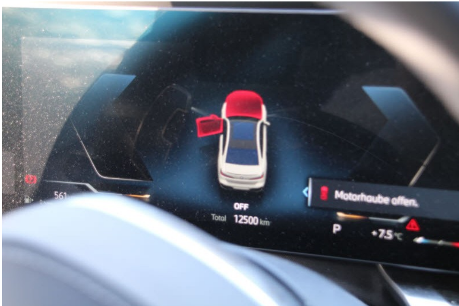
Bild 16 Abgelesene Laufleistung.