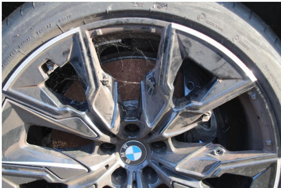
Bild 13 Speichenabdeckungen vorn links gebrochen.