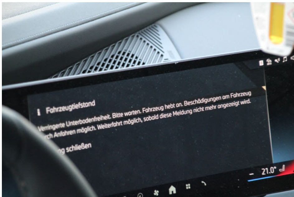
Bild 14 Meldung Luftfederfahrwerk.