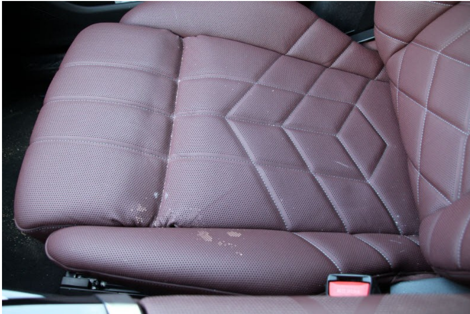
Bild 11 Beifahrersitz verschmutzt.