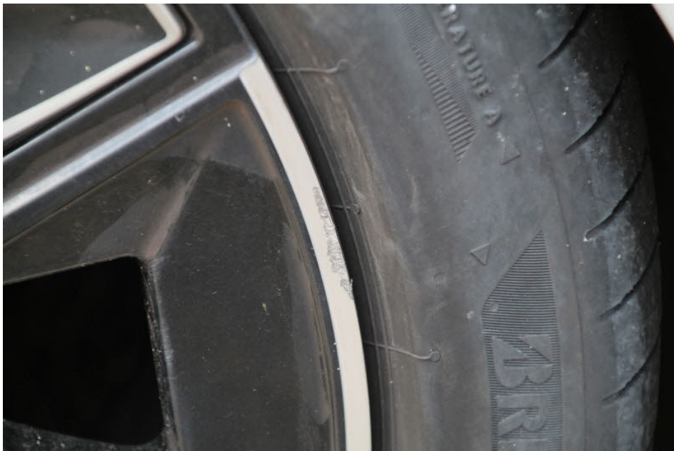
Bild 12 Felgenhorn vorn rechts verschürft.