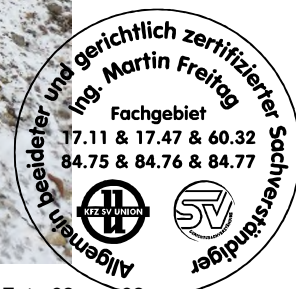
Fahrzeug Foto 62 von 62