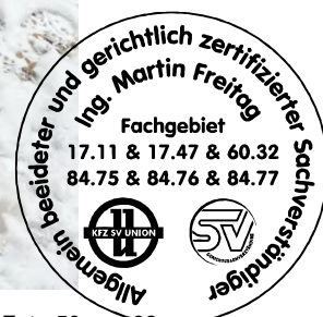
Fahrzeug Foto 50 von 62