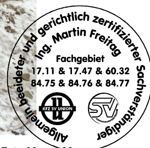
Fahrzeug Foto 38 von 62