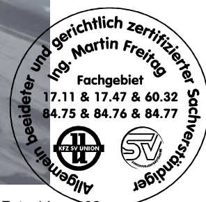
Fahrzeug Foto 14 von 62