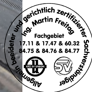
Fahrzeug Foto 28 von 62