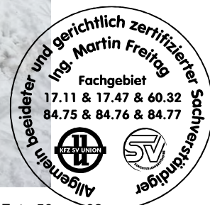
Fahrzeug Foto 56 von 62