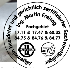
Fahrzeug Foto 20 von 44