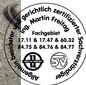
Fahrzeug Foto 30 von 44