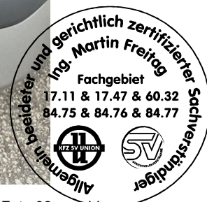
Fahrzeug Foto 32 von 44