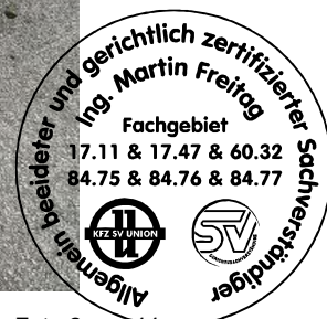
Fahrzeug Foto 2 von 44