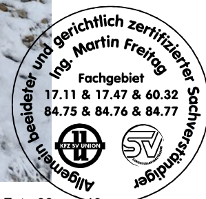
Fahrzeug Foto 38 von 40