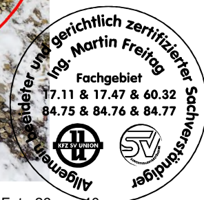
Fahrzeug Foto 26 von 40