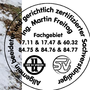
Fahrzeug Foto 36 von 40