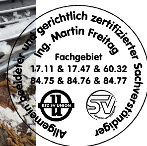
Fahrzeug Foto 24 von 40