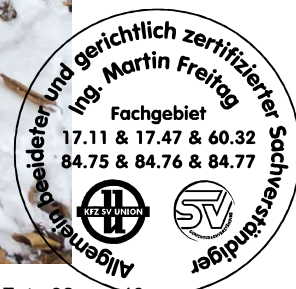
Fahrzeug Foto 32 von 40