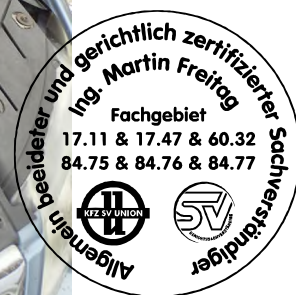
Fahrzeug Foto 16 von 40