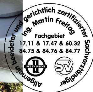
Fahrzeug Foto 48 von 50