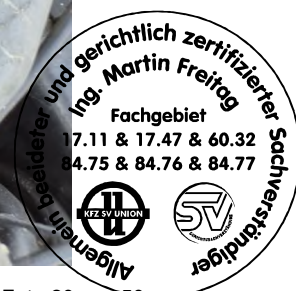
Fahrzeug Foto 20 von 50