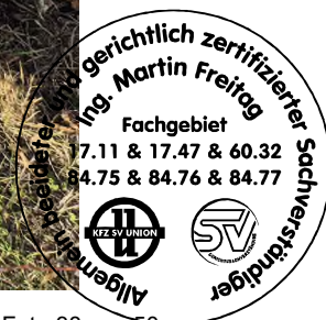
Fahrzeug Foto 38 von 50