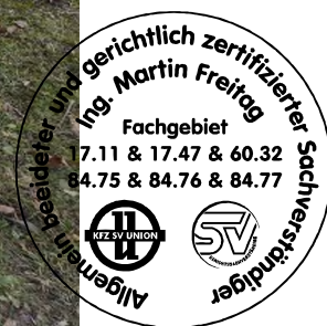
Fahrzeug Foto 36 von 50