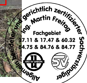
Fahrzeug Foto 32 von 50