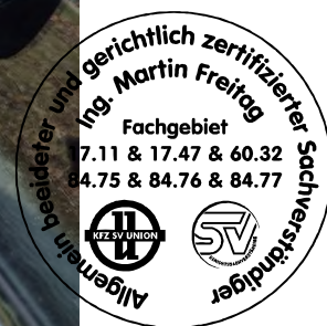
Fahrzeug Foto 30 von 50