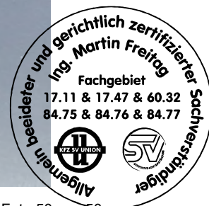
Fahrzeug Foto 50 von 50