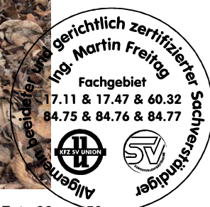
Fahrzeug Foto 26 von 50