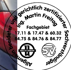
Fahrzeug Foto 4 von 60