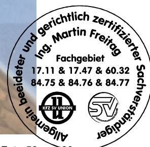
Fahrzeug Foto 56 von 60