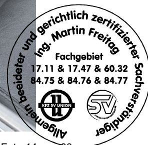
Fahrzeug Foto 14 von 60