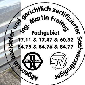
Fahrzeug Foto 22 von 60