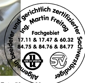
Fahrzeug Foto 50 von 60