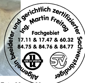
Fahrzeug Foto 38 von 60