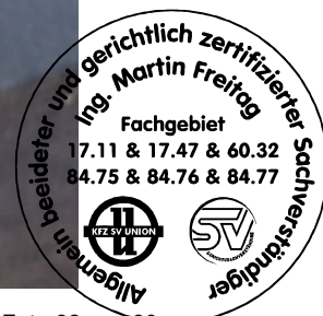
Fahrzeug Foto 32 von 60