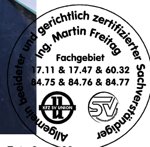
Fahrzeug Foto 2 von 60