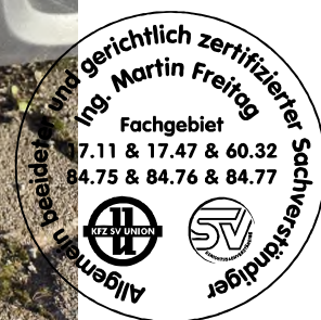
Fahrzeug Foto 58 von 60