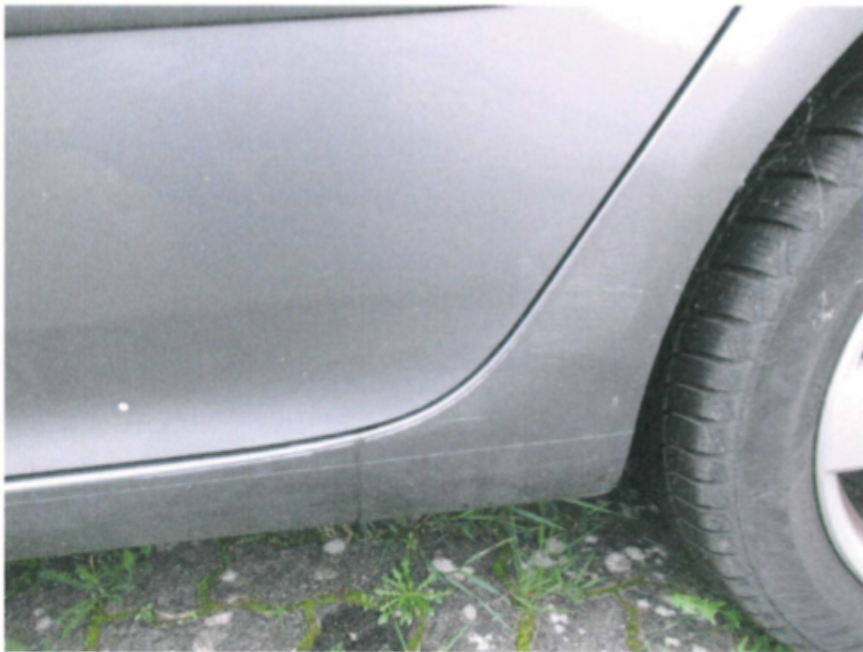
Bild 6 : Tür hinten links verschrammt mit Stoßleiste Kniestück hinten links eingedrückt/ verschrammt