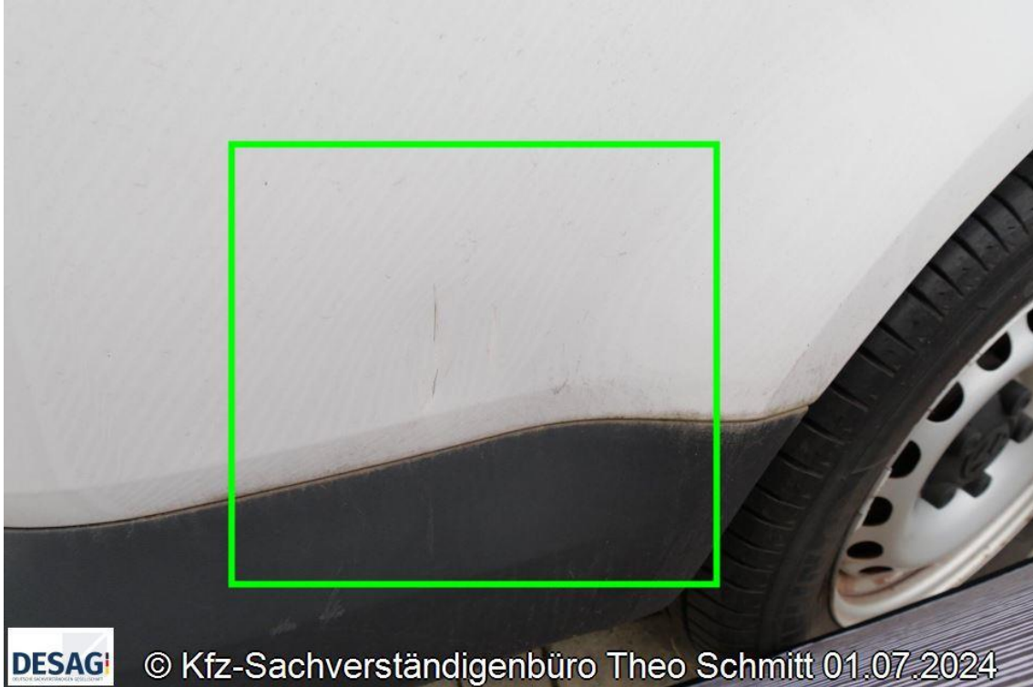
Foto 19: Übersicht nichtreparierter Vorschaden an Seitenwand hinten rechts (darstellung mit Dellenspiegel)