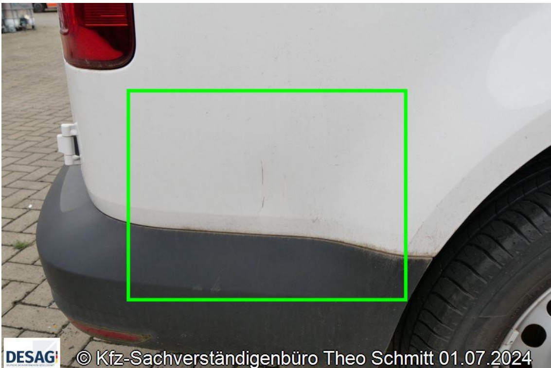
Foto 18: Übersicht nichtreparierter Vorschaden an Seitenwand hinten rechts