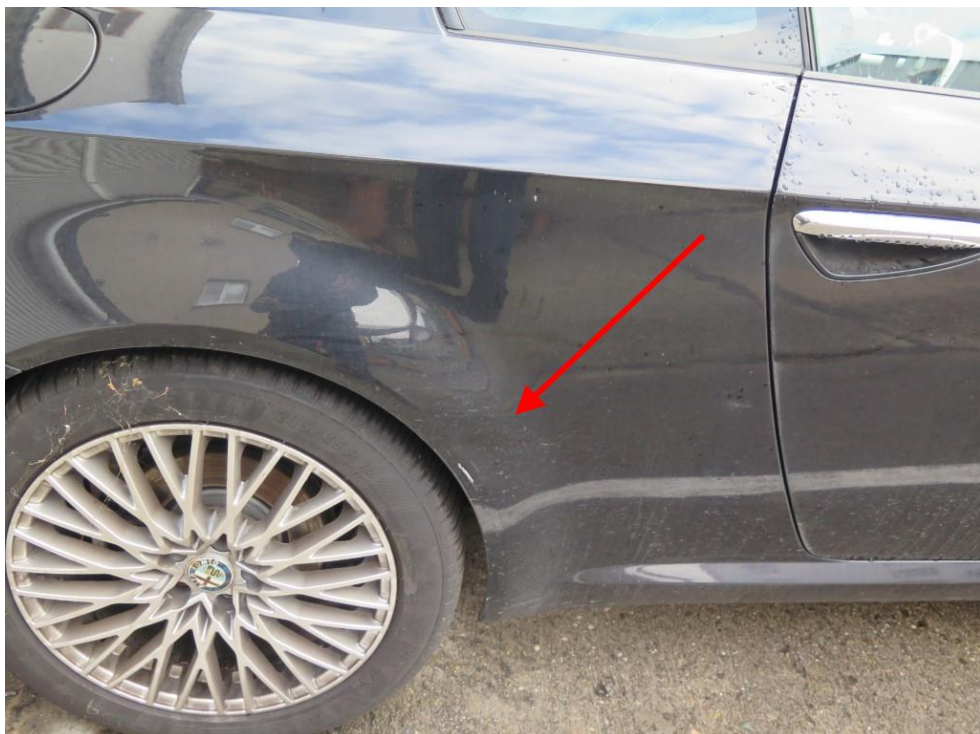
Die rechte Seitenwand ist eingedellt.