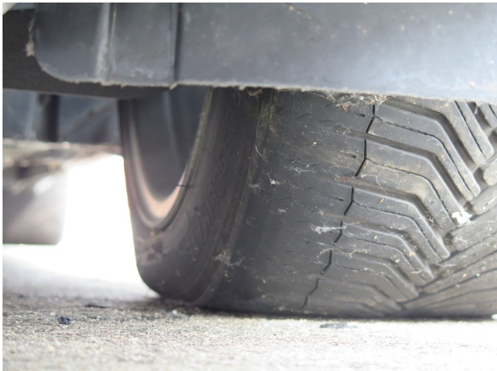
Der linke vordere Reifen ist innen abgefahren.