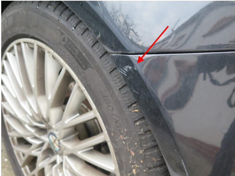
Stoßfänger hinten links.