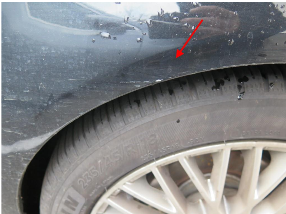
Die Seitenwand hinten links ist verschrämmt.