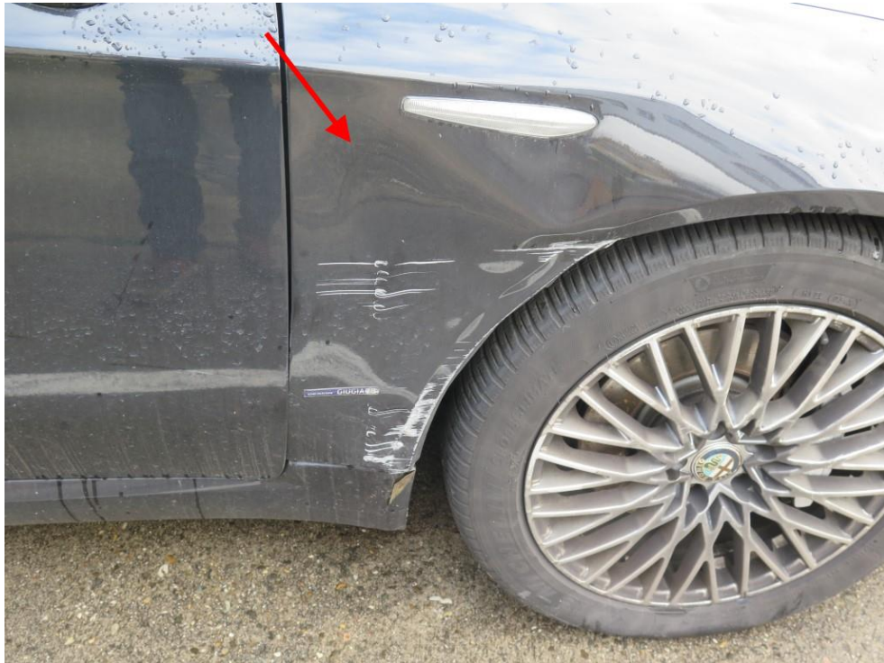
Der vordere rechte Kotflügel ist eingedrückt.