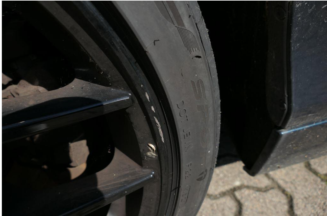
Felgen mit Kantsteinbeschädigungen