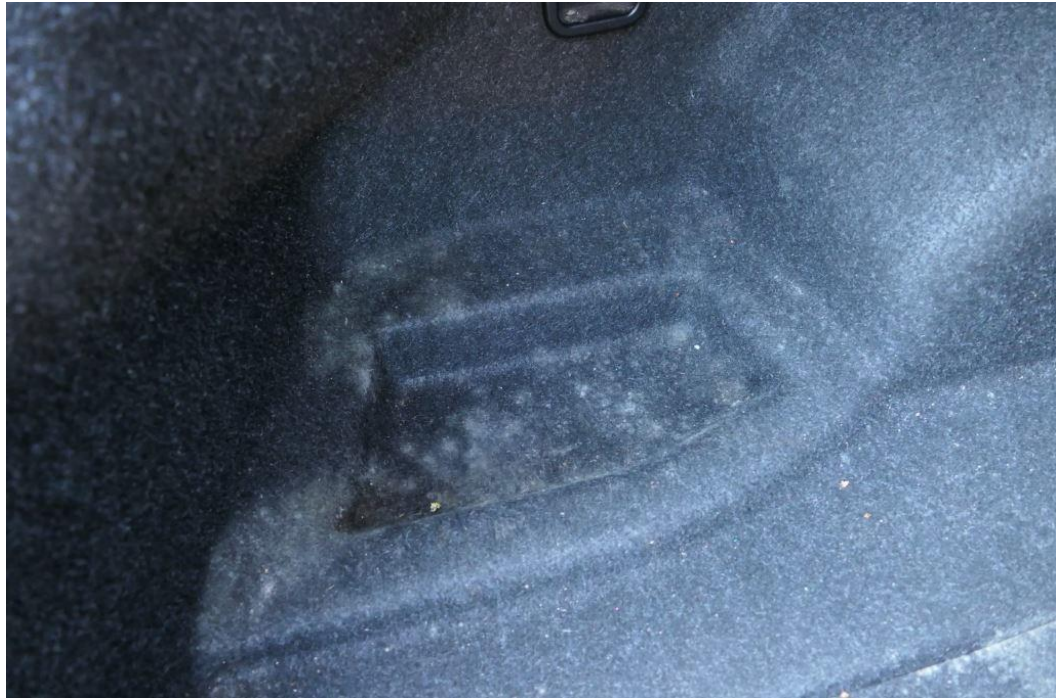
Schimmelbefall im Kofferraum