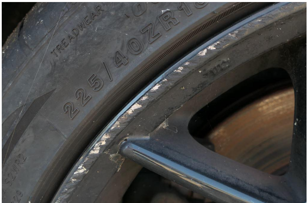
Felgen mit Kantsteinbeschädigungen