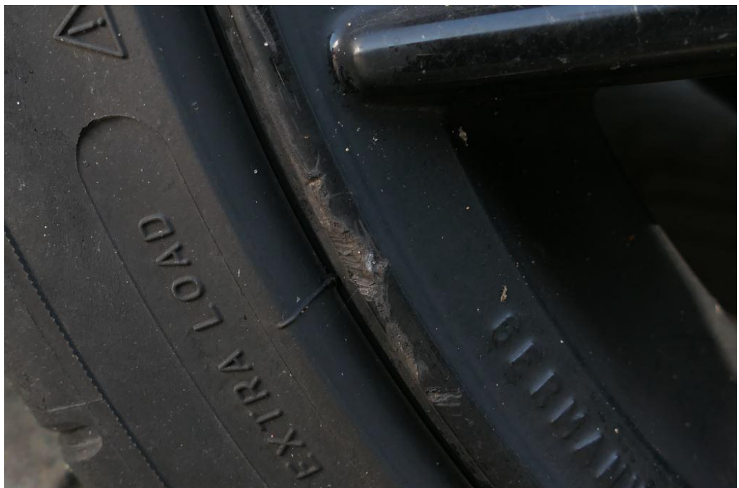
Felgen mit Kantsteinbeschädigungen