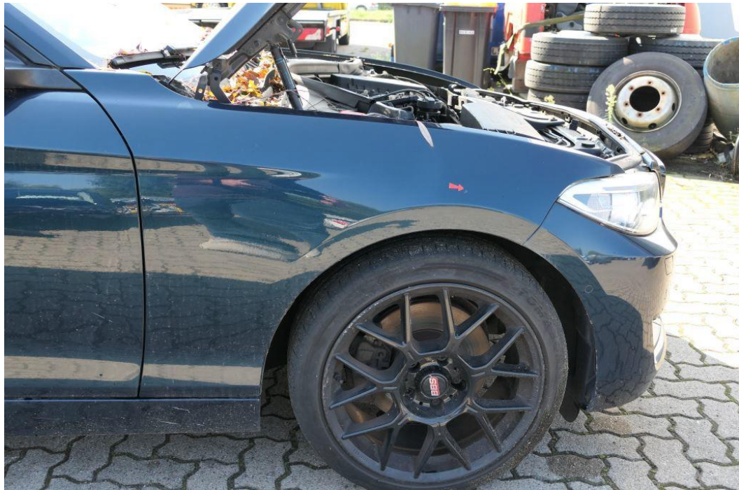
Kotflügel vorne rechts eingedellt/verkratzt