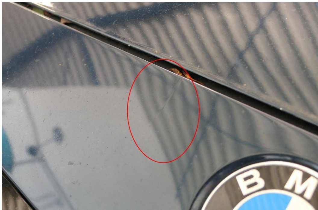
Stoßfänger vorn plastisch verformt