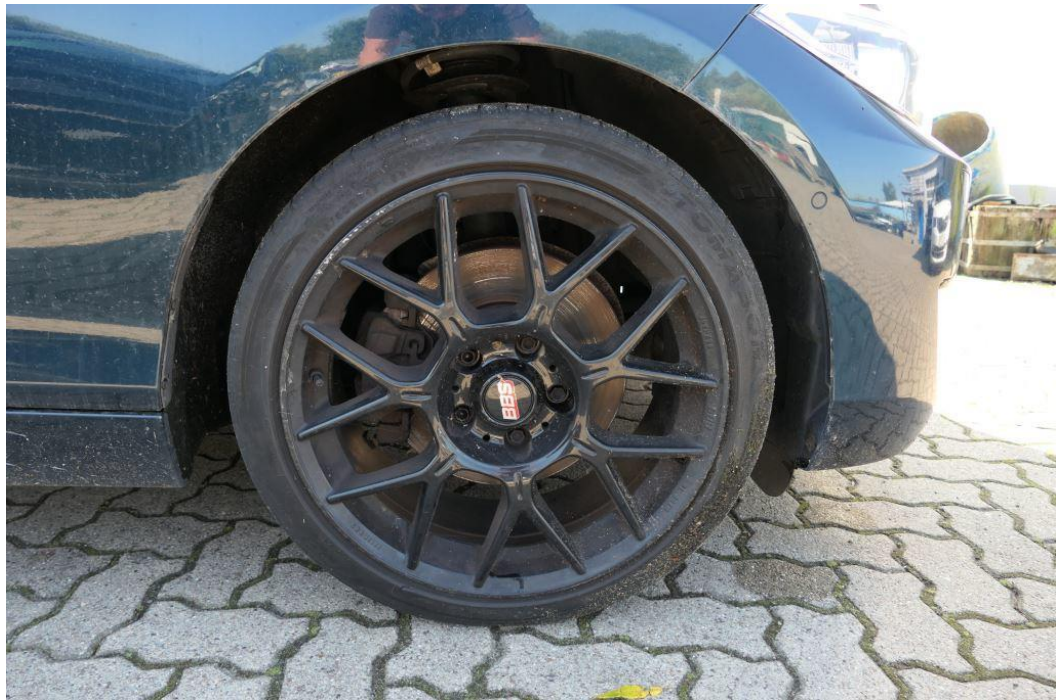
Felgen mit Kantsteinbeschädigungen