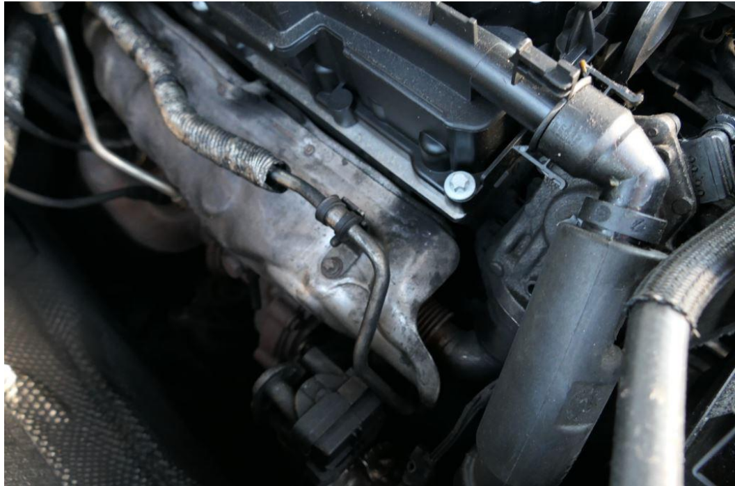
Motor/Abgassystem Undicht, Motor/Turbolader macht Geräusche