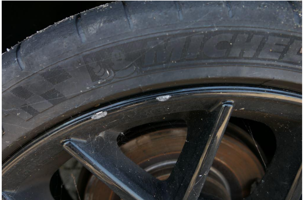
Felgen mit Kantsteinbeschädigungen