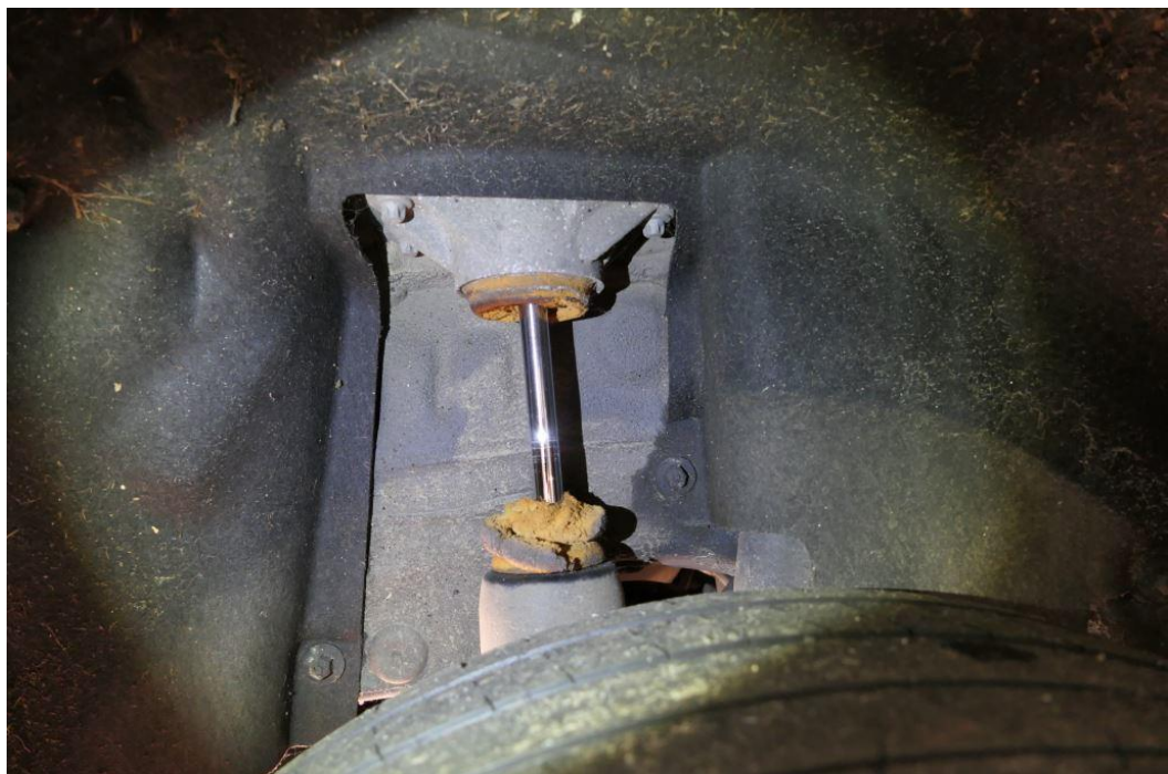
Anschlagpuffer Stoßdämpfer hinten rechts, gerissen