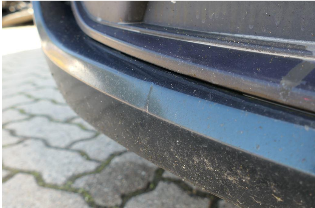
Stoßfänger vorn plastisch verformt