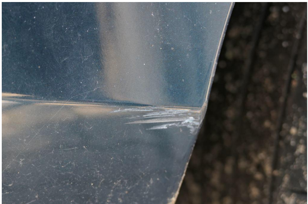
Stoßfänger hinten verschürft