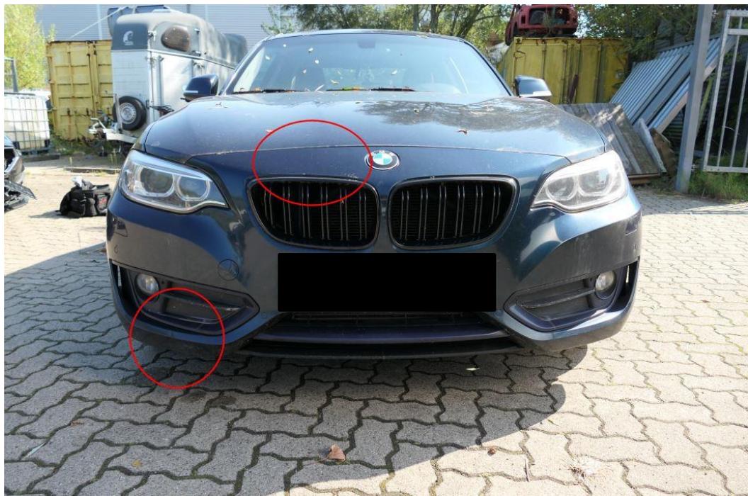
Stoßfänger vorn plastisch verformt