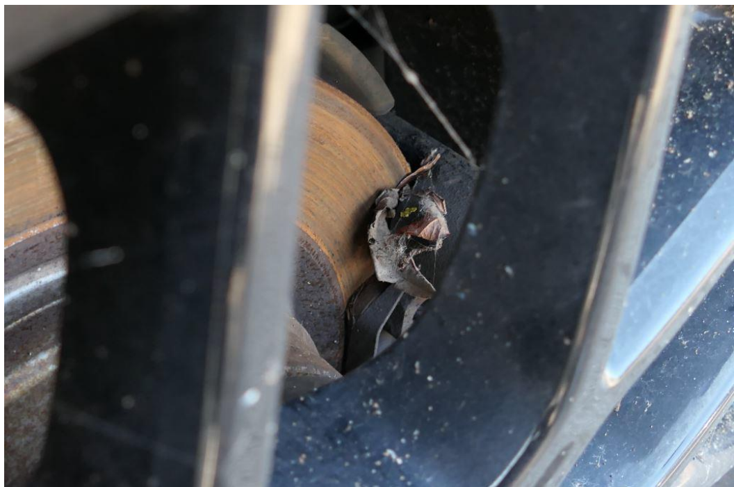
Bremsbeläge hinten verschlissen