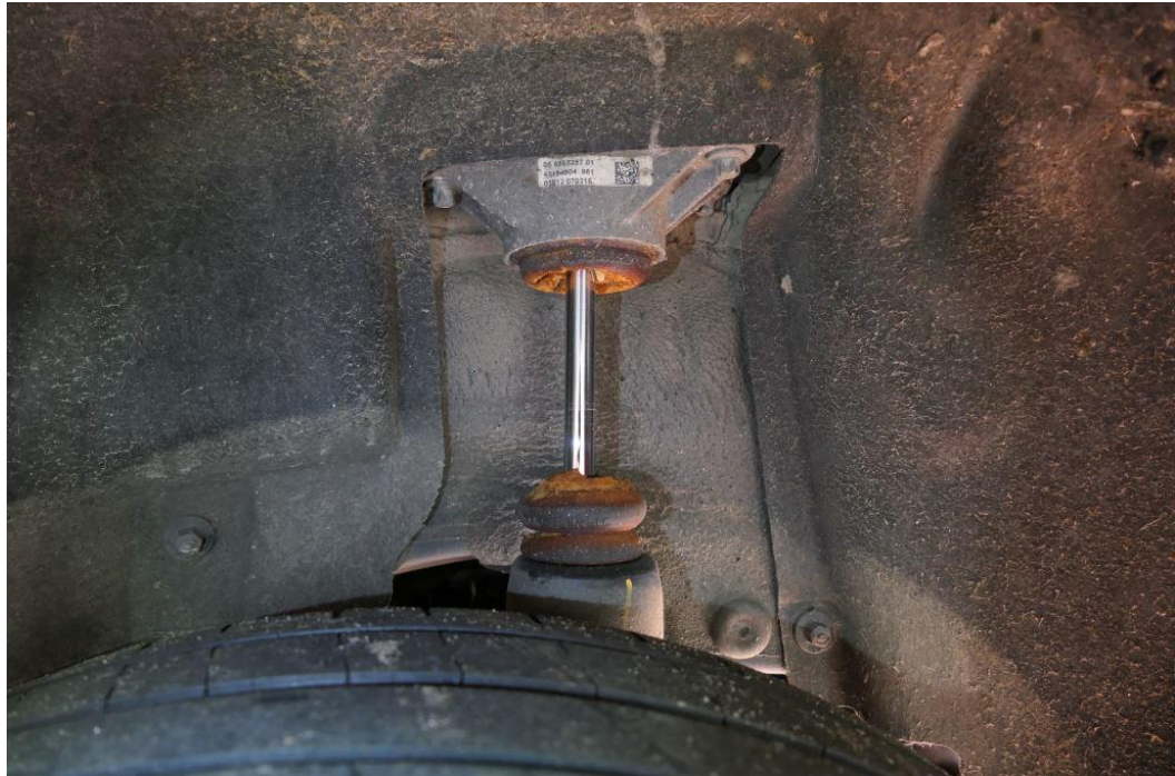
Anschlagpuffer Stoßdämpfer hinten links, gerissen