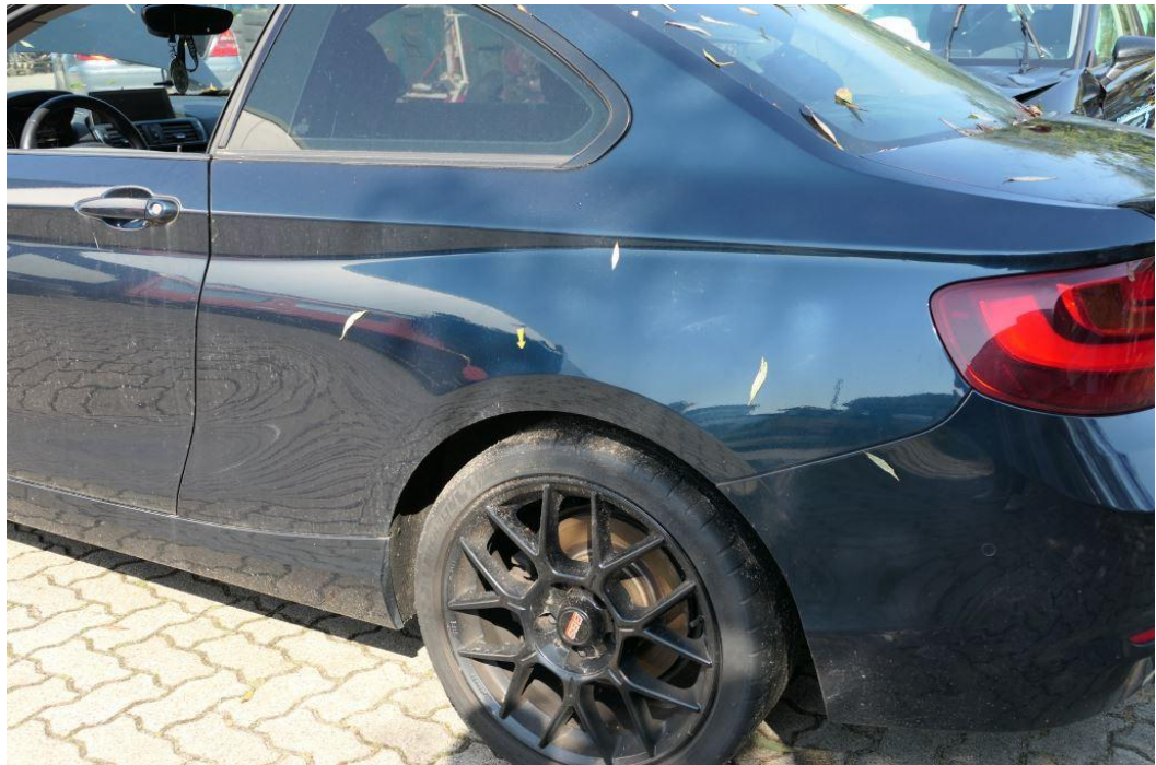
Seitenteil links, Delle