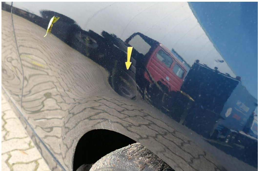
Seite links, Delle