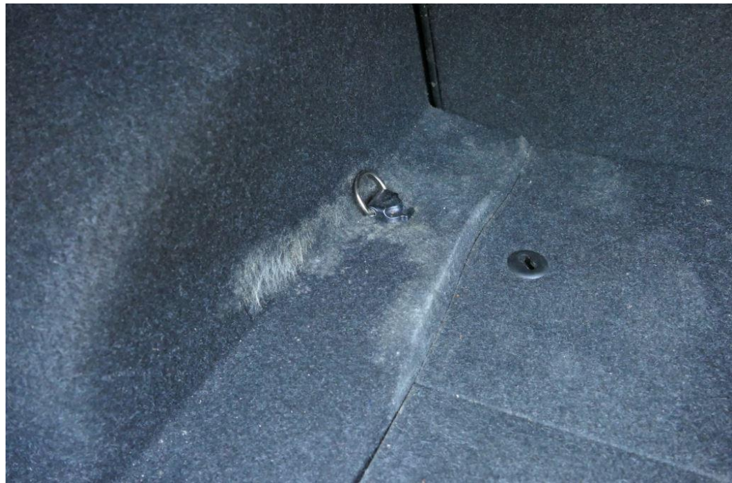
Schimmelbefall im Kofferraum