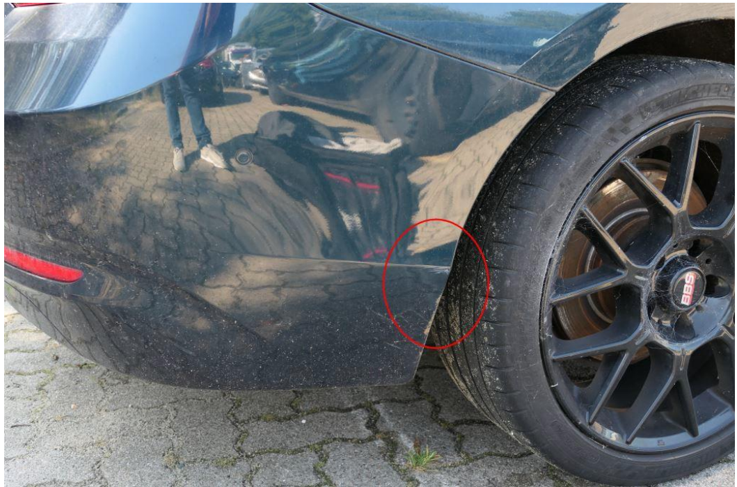
Stoßfänger hinten verschürft