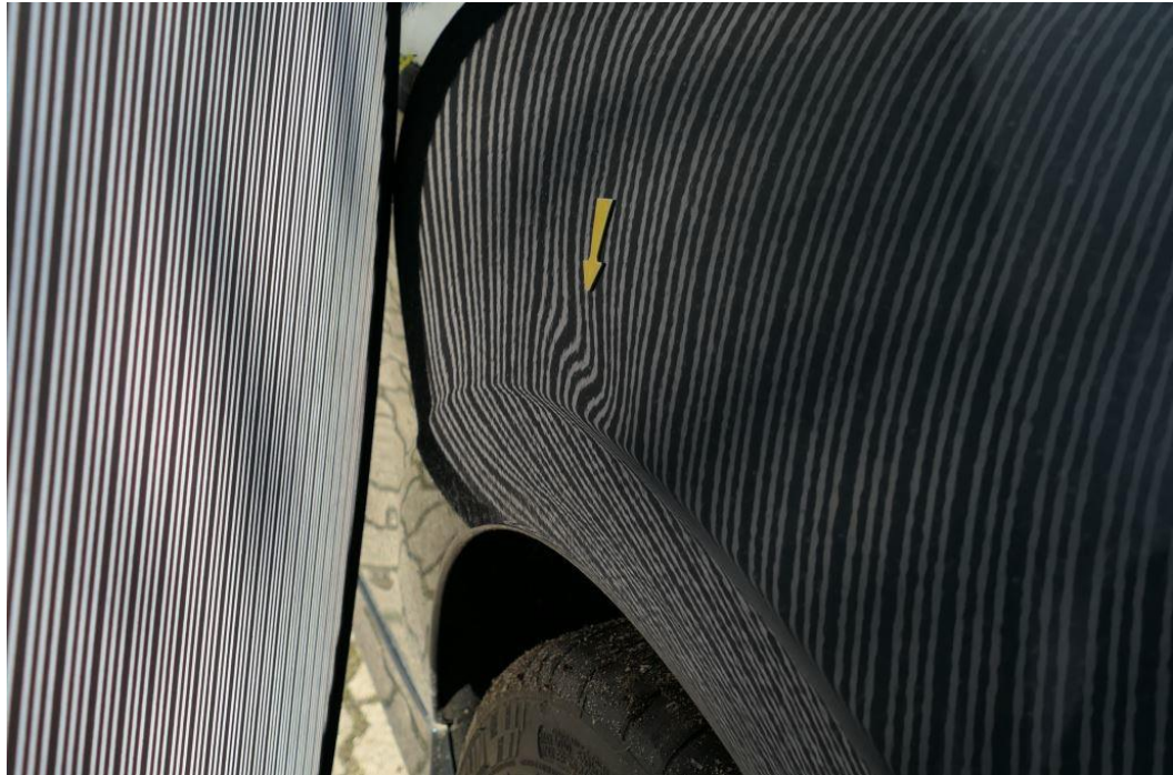
Seitenteil links, Delle