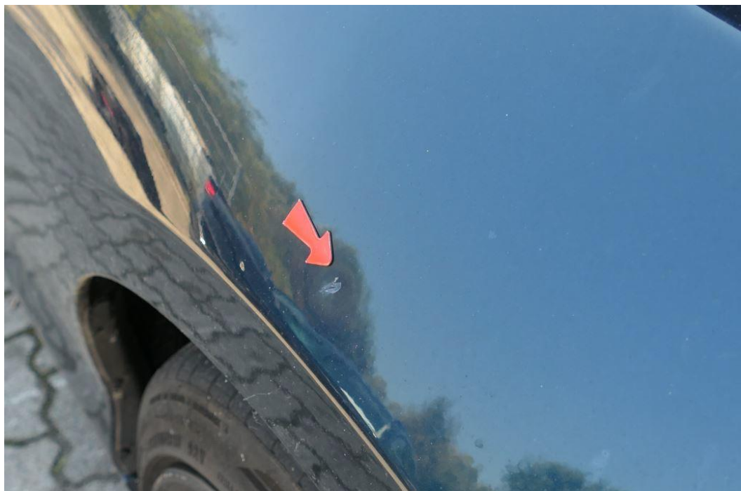
Kotflügel vorne rechts eingedellt/verkratzt