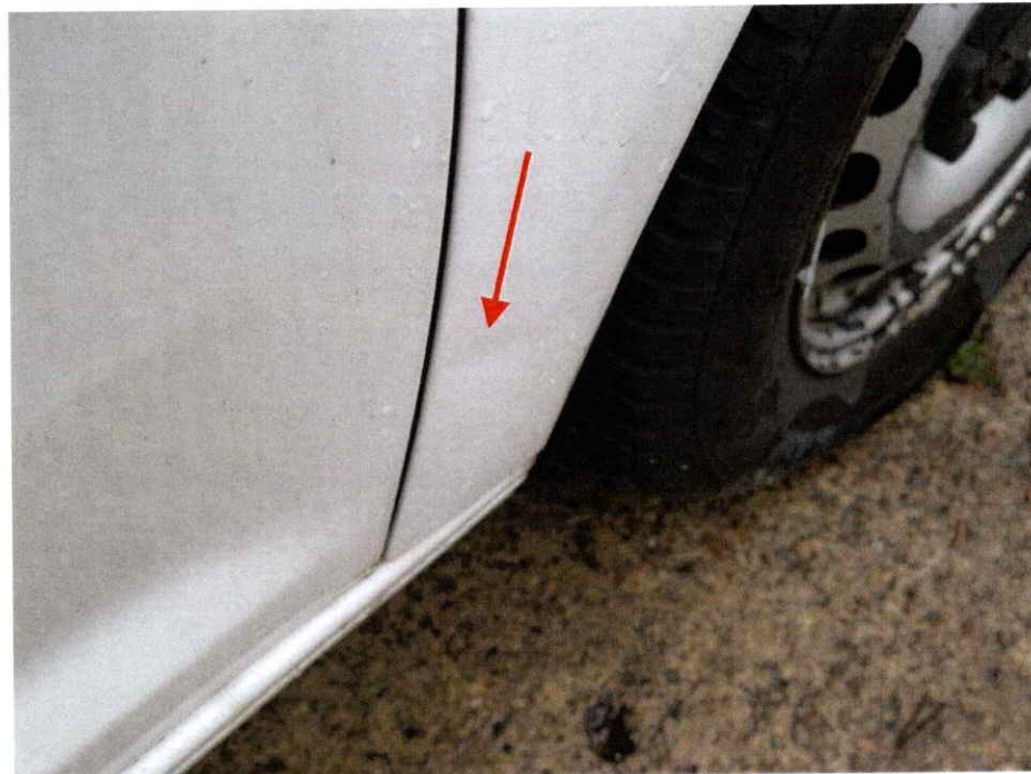
Der vordere rechte Kotflügel ist verkratzt.