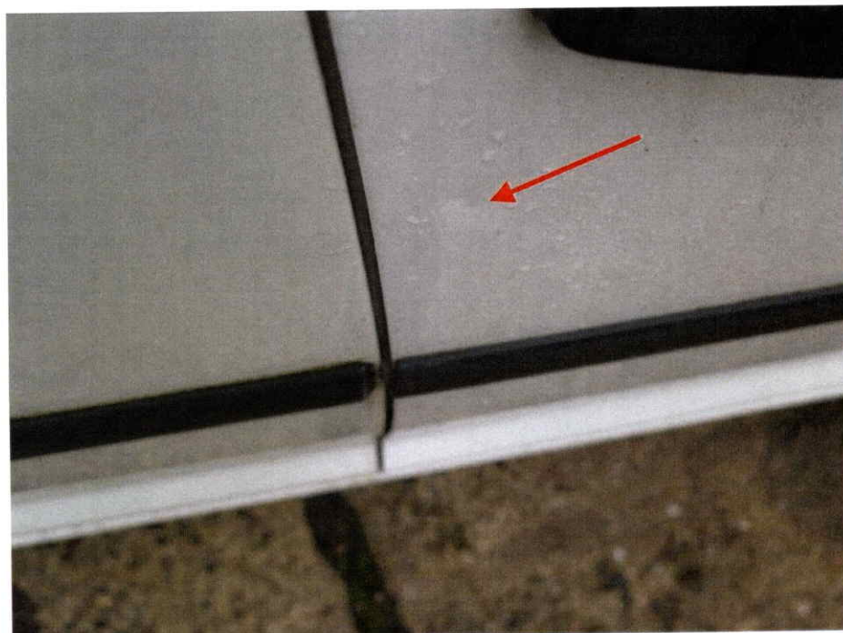
Die Beifahrertür ist leicht eingedellt.