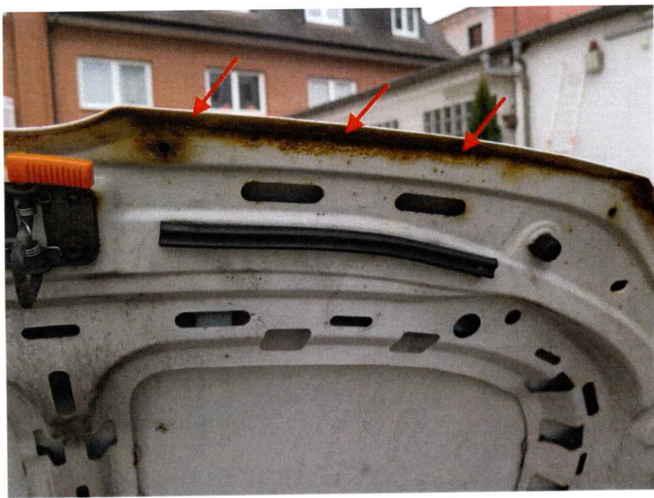
Die Motorhaube weist Rostansätze auf.