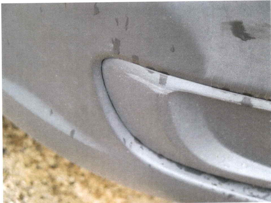
Die vordere Stoßfängeraußenhaut ist leicht verschrammt.