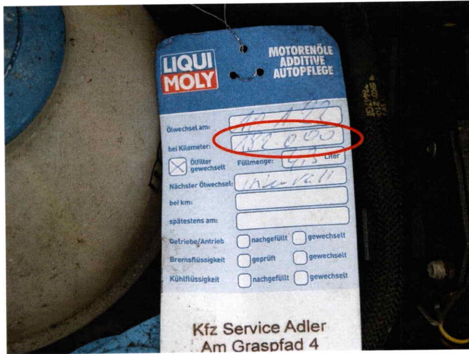
Laufleistung am 10.01.2022 182.000 km laut Ölzettel