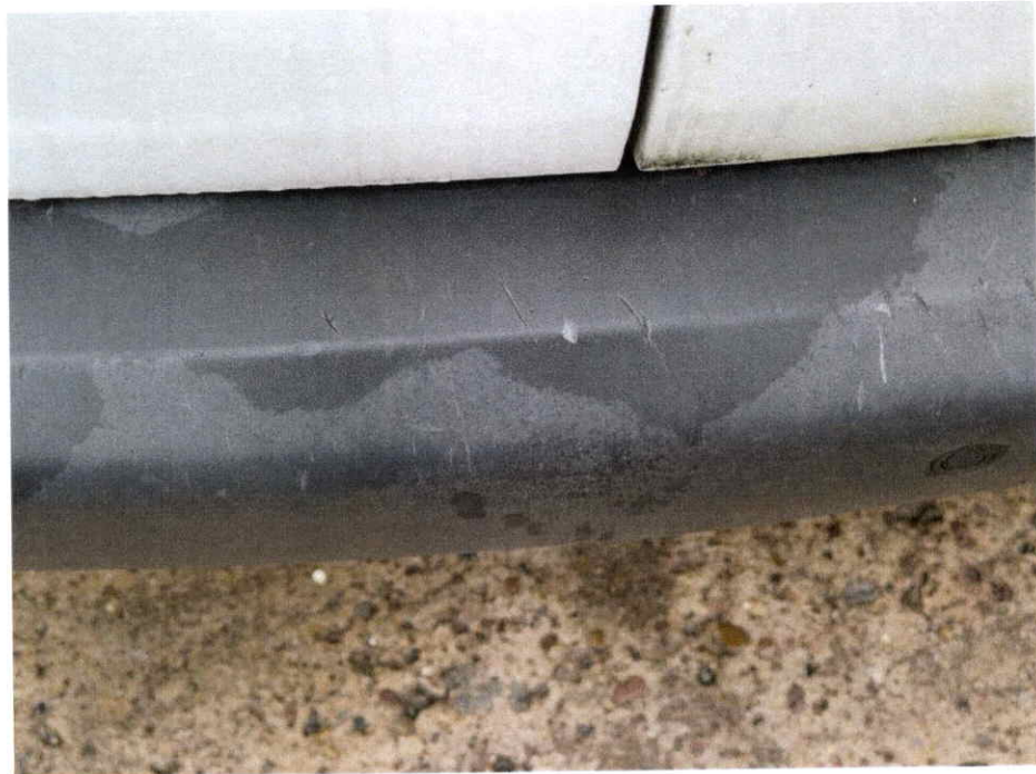
Die hintere Stoßstange ist verkratzt.