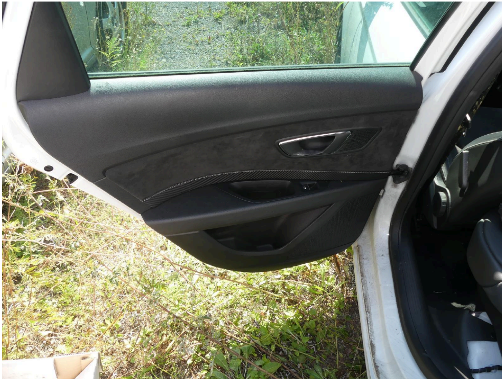
Bild: 21 Ansicht Türverkleidung hinten links