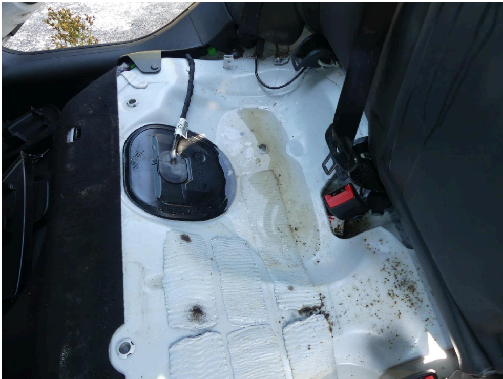
Bild: 27 ... im Bereich Fondsitzbank ist Wasser vorhanden.