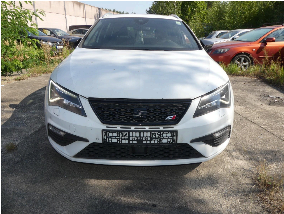
Bild: 5 Frontansicht