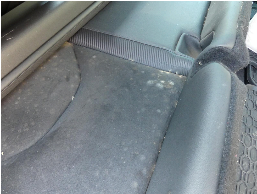
Bild: 23 Detaillierte Darstellung Sitzbank Fondbereich (Schimmelbildung)