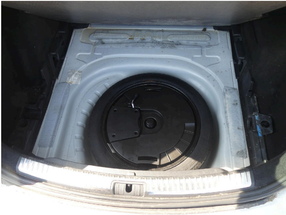
Bild: 29 Ansicht Kofferboden mit Notrad.