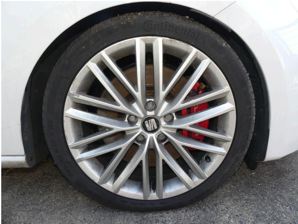
Bild: 43 Ansicht Rad/Reifenkombination vorn rechts