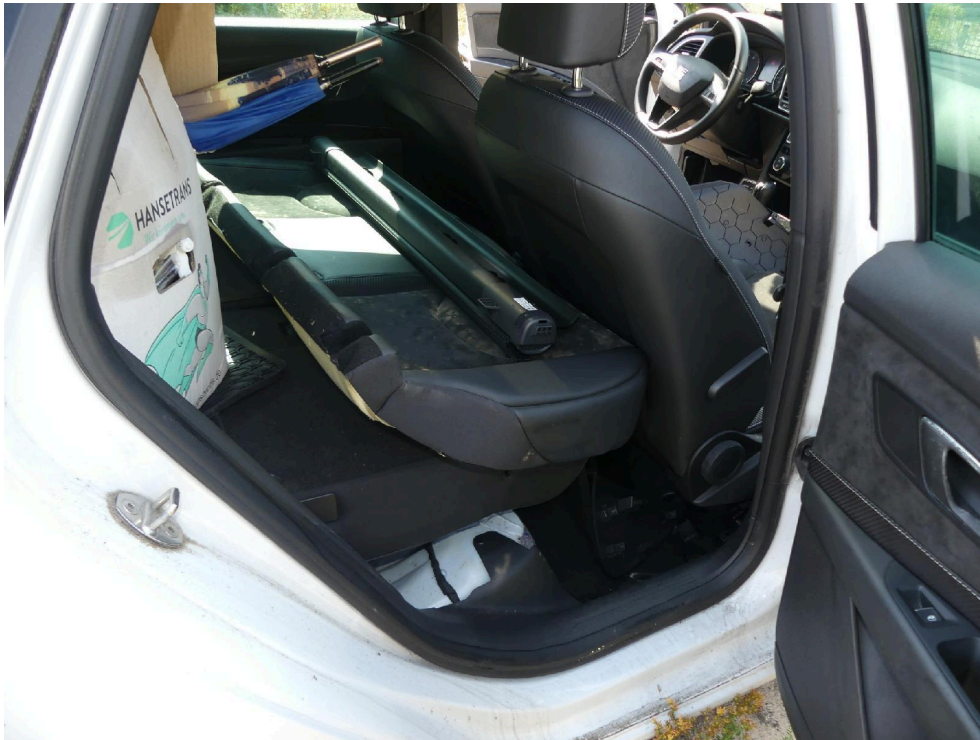
Bild: 31 Innenraum, hinten rechts