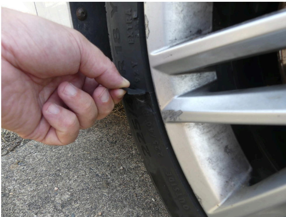
Bild: 46 Radialreifen vorn rechts im Bereich der Reifenflanke beschädigt.