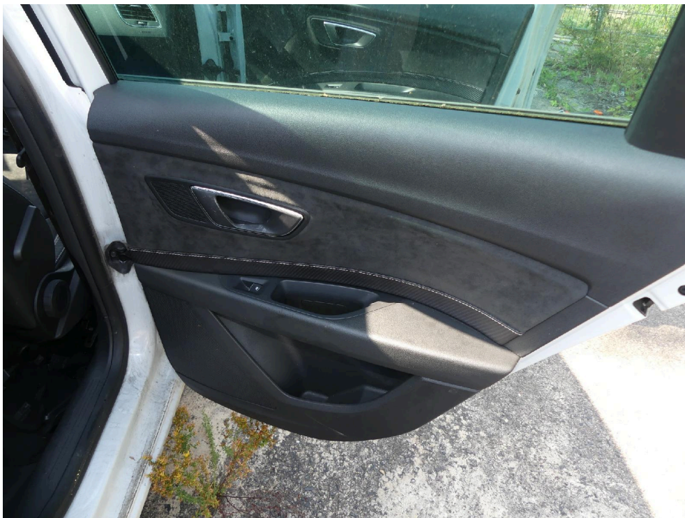
Bild: 30 Ansicht Türverkleidung hinten rechts