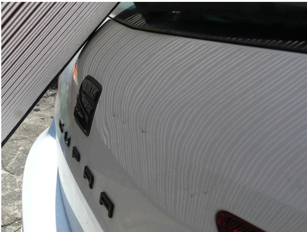
Bild: 52 Heckklappe partiell gestaut.