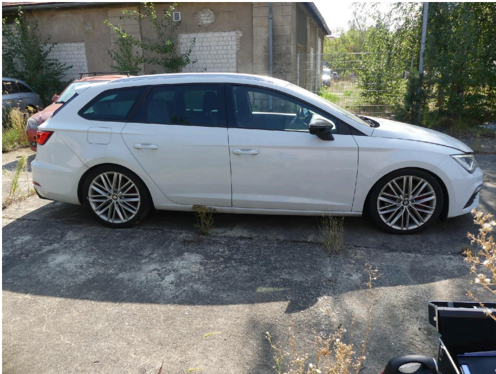
Bild: 8 Seitenansicht von rechts