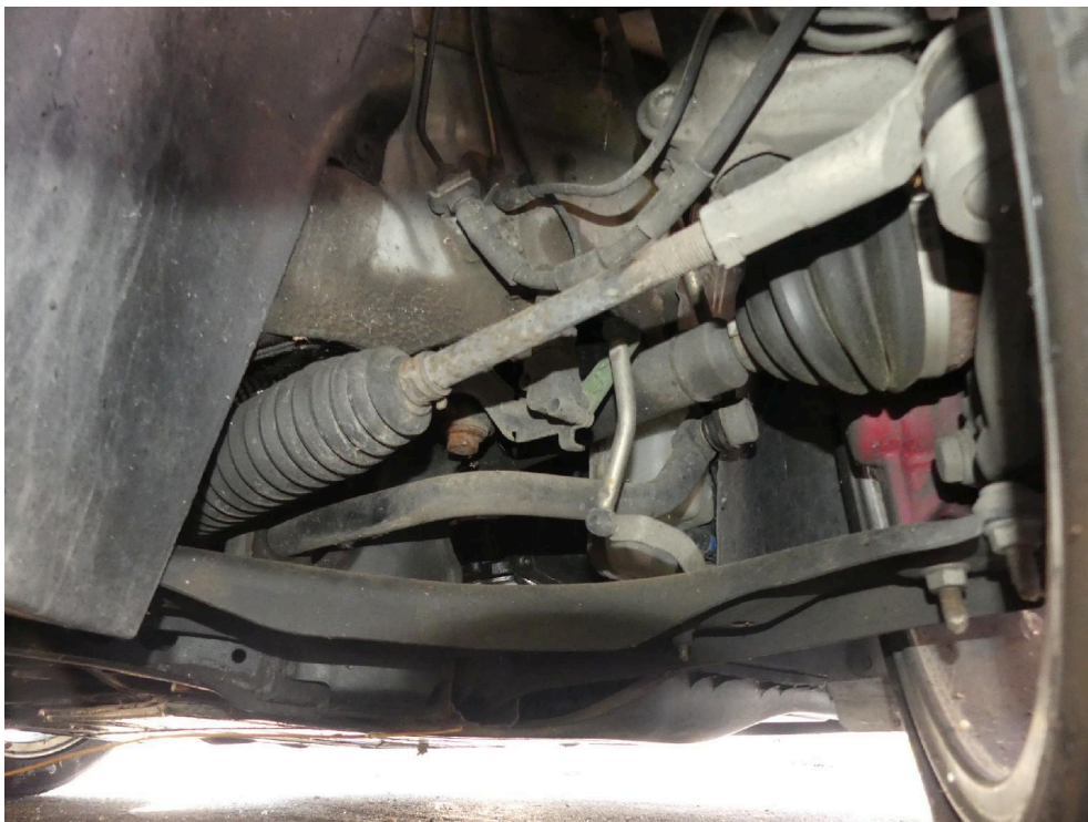
Bild: 54 Ansicht Vorderachse rechts