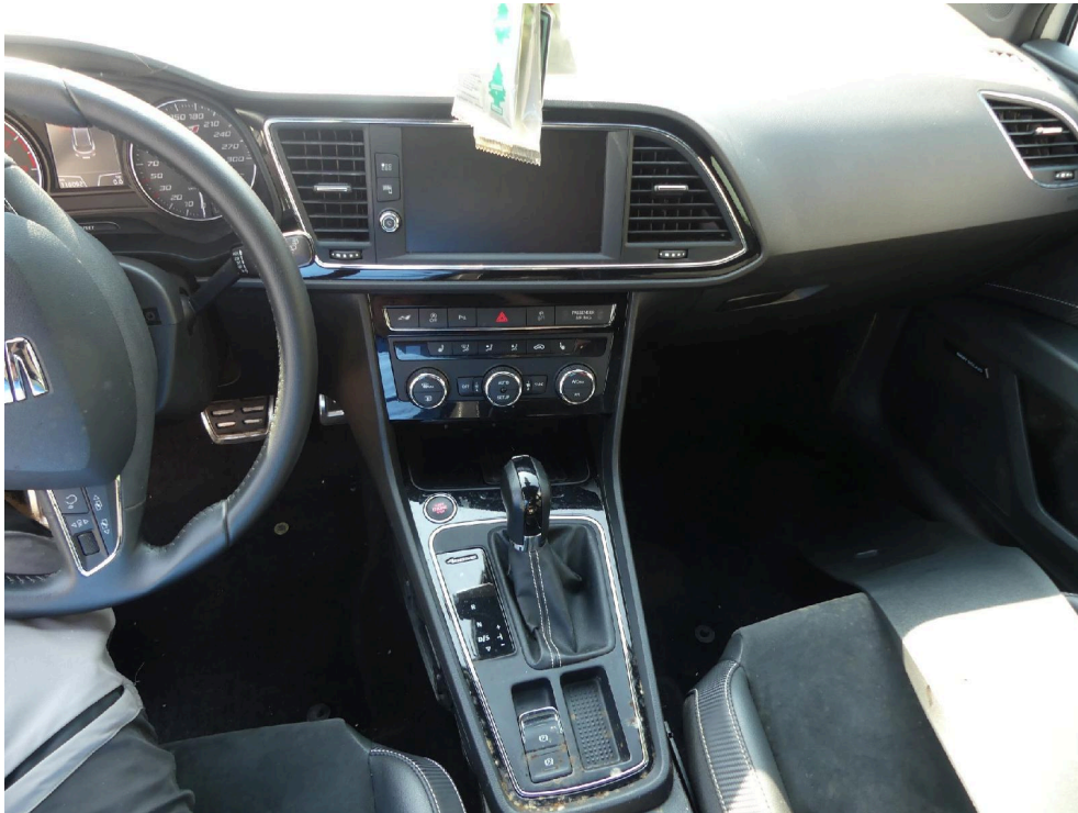
Bild: 17 Übersichtsaufnahme Innenraum