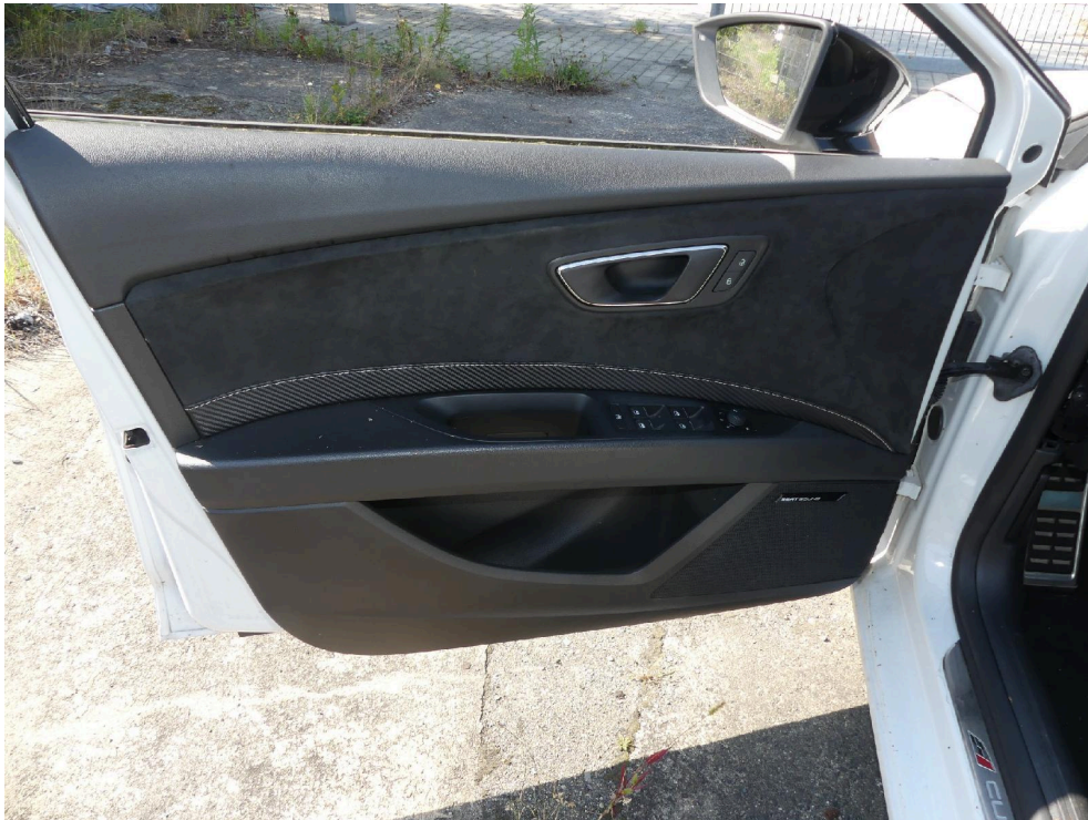
Bild: 11 Ansicht Türverkleidung vorn links