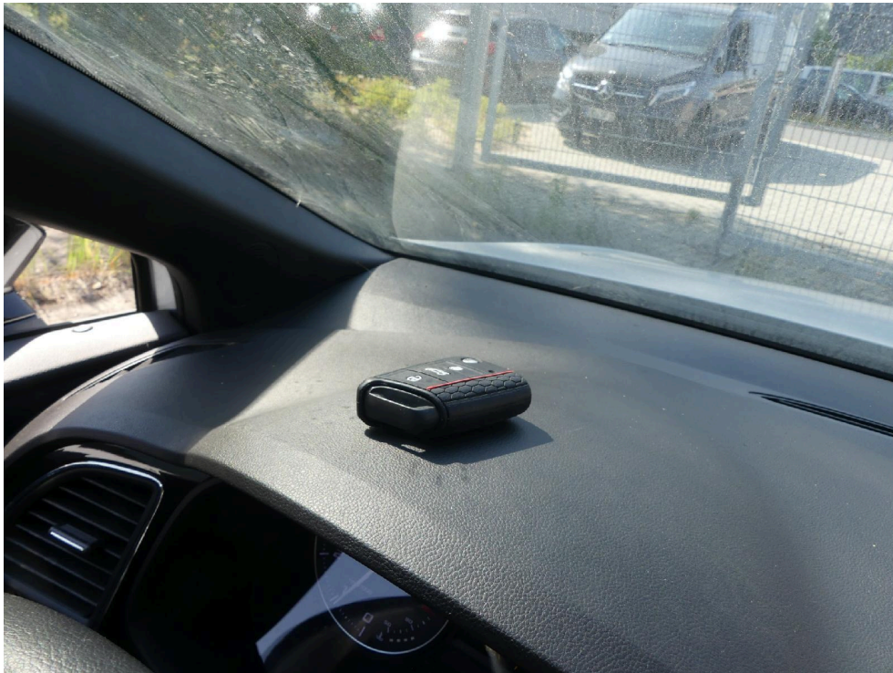
Bild: 19 1x Fahrzeugschlüssel vorhanden.