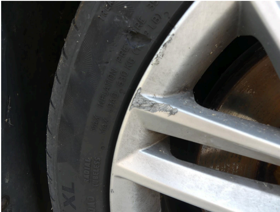
Bild: 45 Ansicht wie vor mit weitere ausweisung einer Beschädigung.