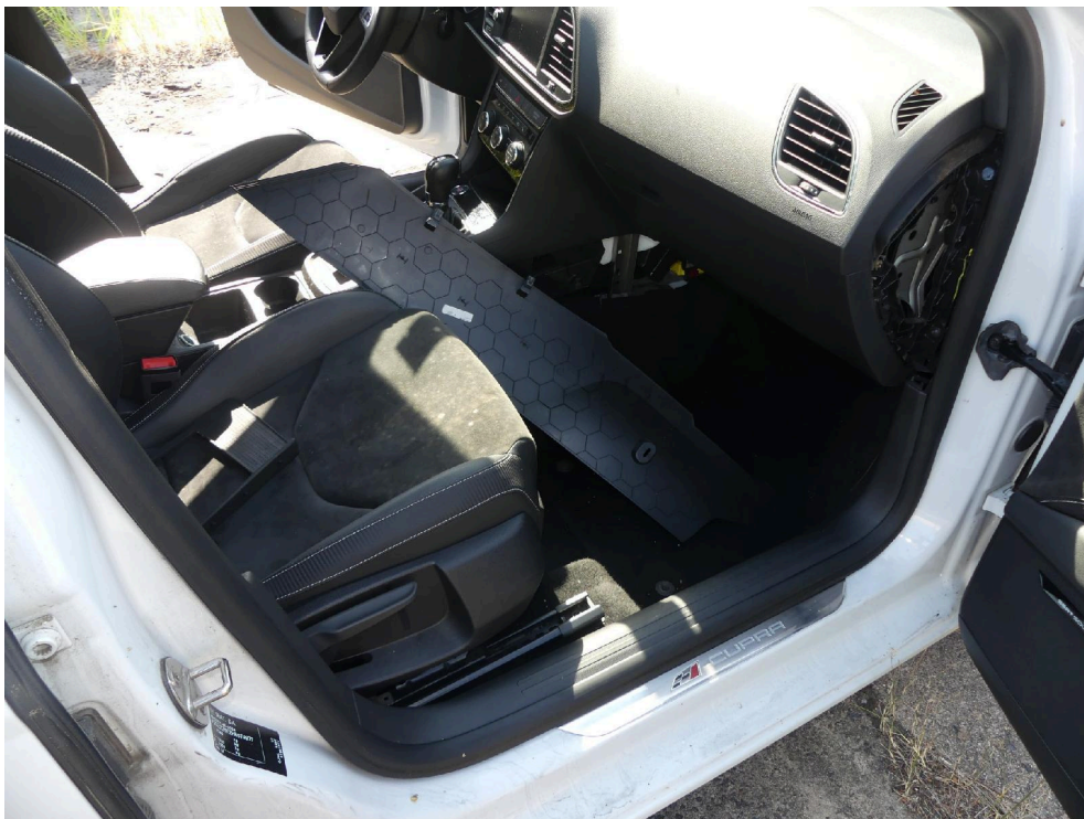
Bild: 34 Innenraum, vorn rechts