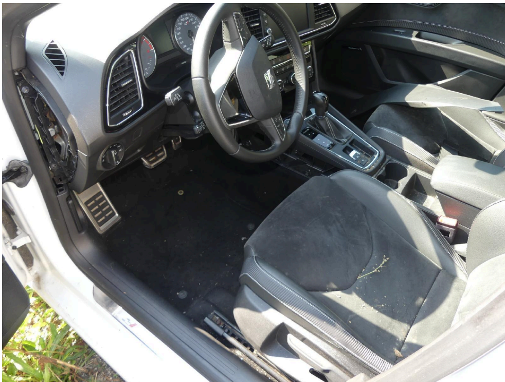
Bild: 12 Innenraum, vorn links