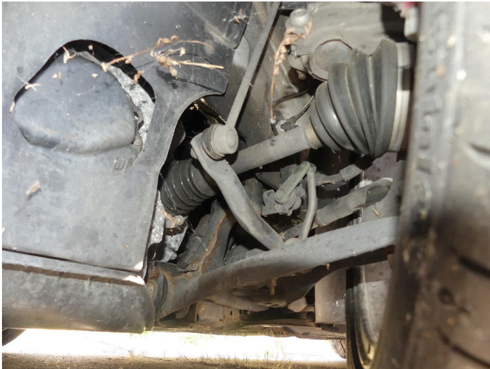
Bild: 53 Ansicht Vorderachse links