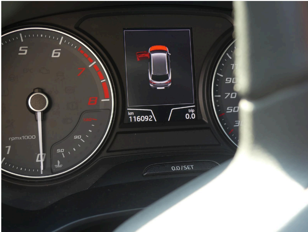
Bild: 15 Ausweisung der abgelesenen Gesamtleistung zum Zeitpunkt der Besichtigung.