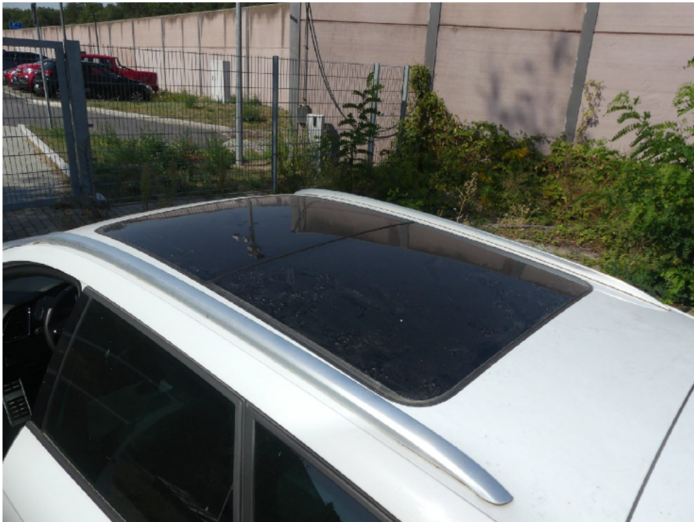
Bild: 9 Ansicht Fahrzeugdach