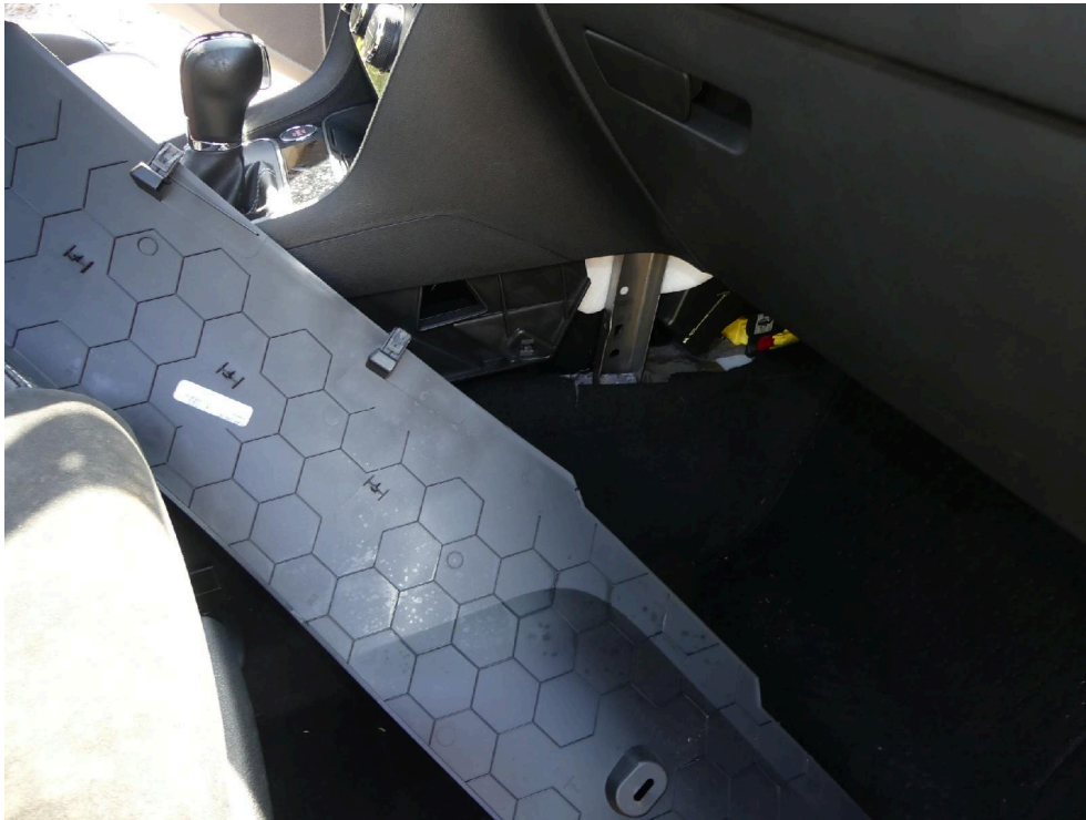
Bild: 35 Die seitliche Verkleidung Mittelkonsole ist demontiert.