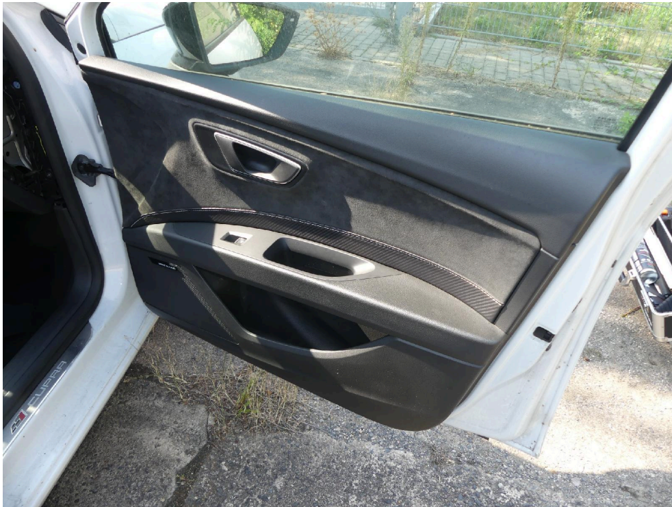
Bild: 33 Ansicht Türverkleidung vorn rechts