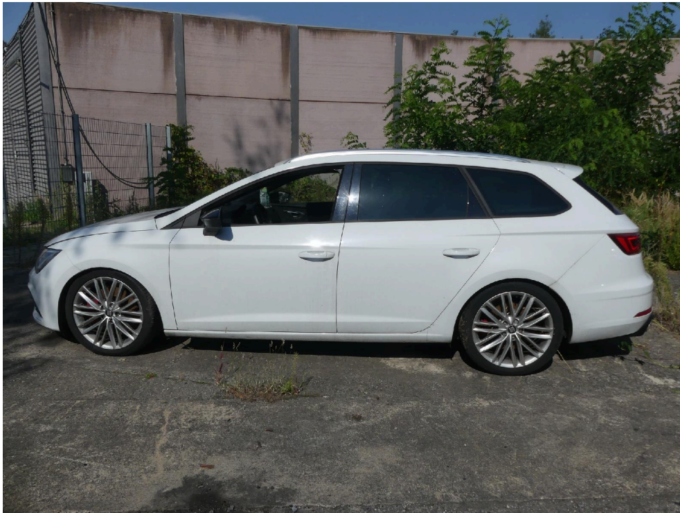
Bild: 7 Seitenansicht von links