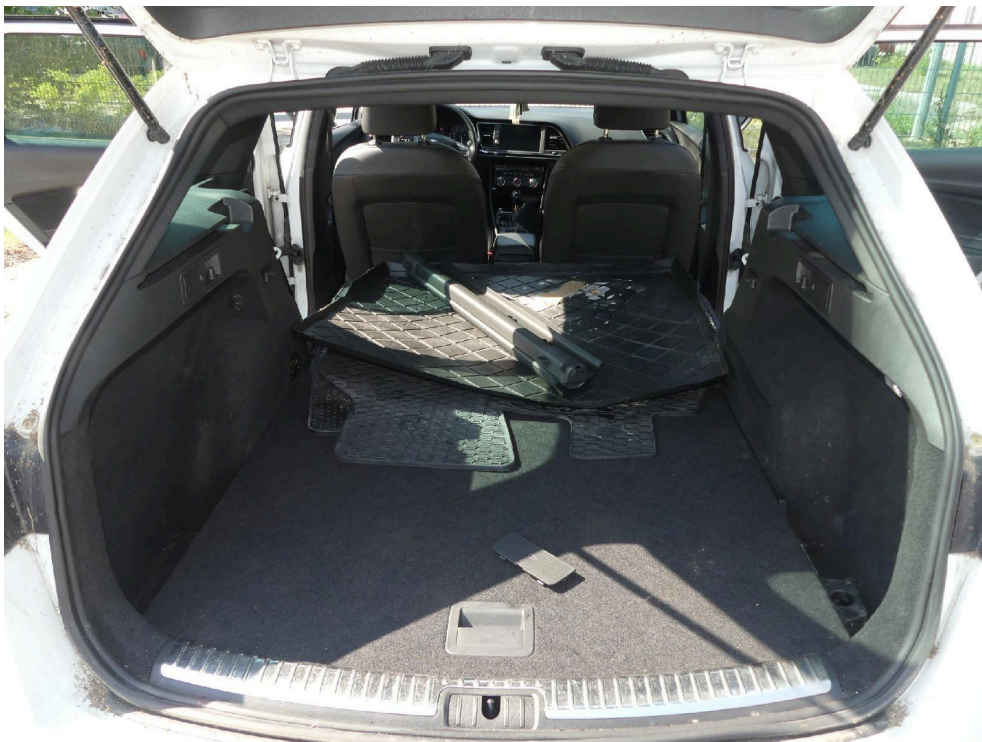
Bild: 28 Ansicht Kofferraum