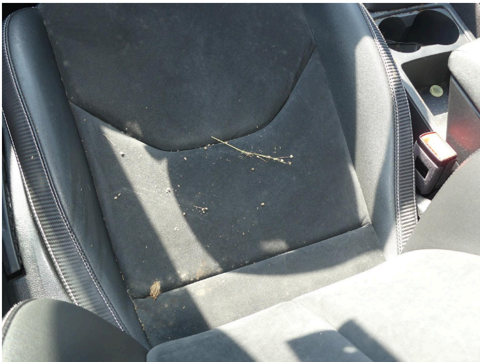
Bild: 14 Schimmelbildung Polster Fahrersitz.