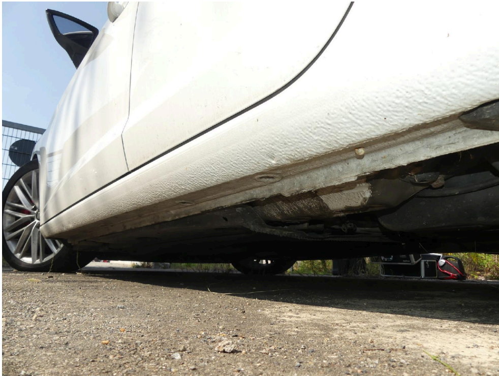
Bild: 39 Ansicht Einstiegsschweller links