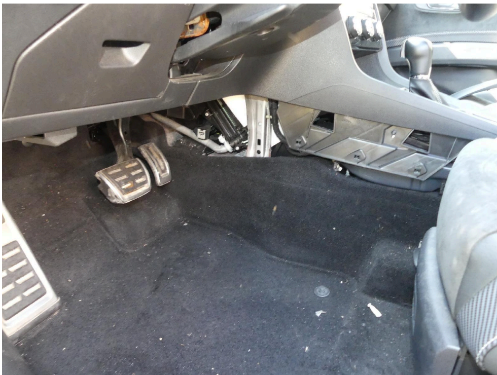
Bild: 16 Detailansicht Innenraum (seitlich Verkleidung demontiert aber vorhanden)