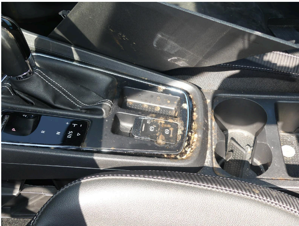
Bild: 18 Detailansicht Innenraum