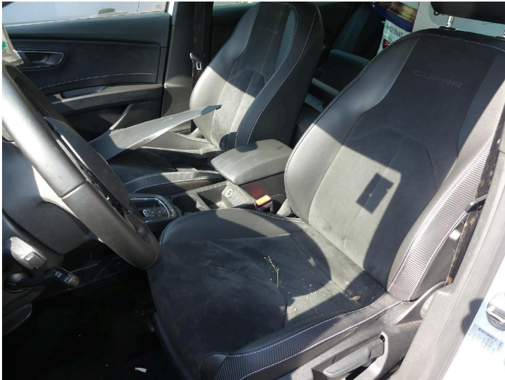
Bild: 13 Einzelansicht Fahrersitz