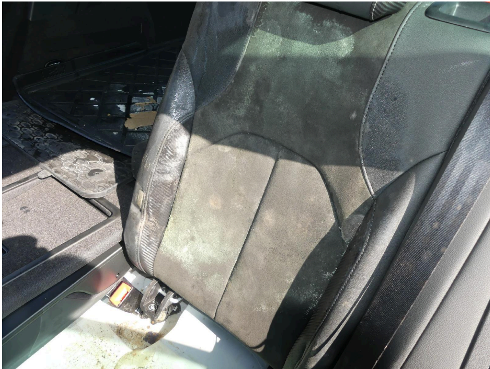
Bild: 25 Ansicht Rückenlehne Fondbereich, hierbei sind ebenso Schimmelspuren vorhanden.