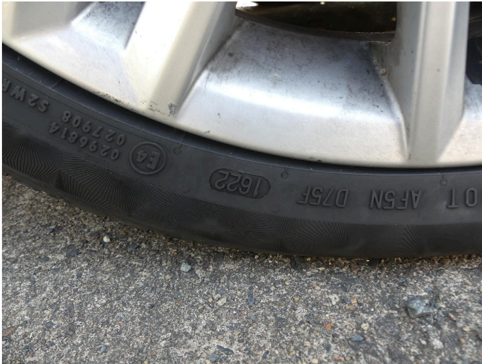
Bild: 47 Ausweisung der DOT Nummer der vorderen Radialreifen.