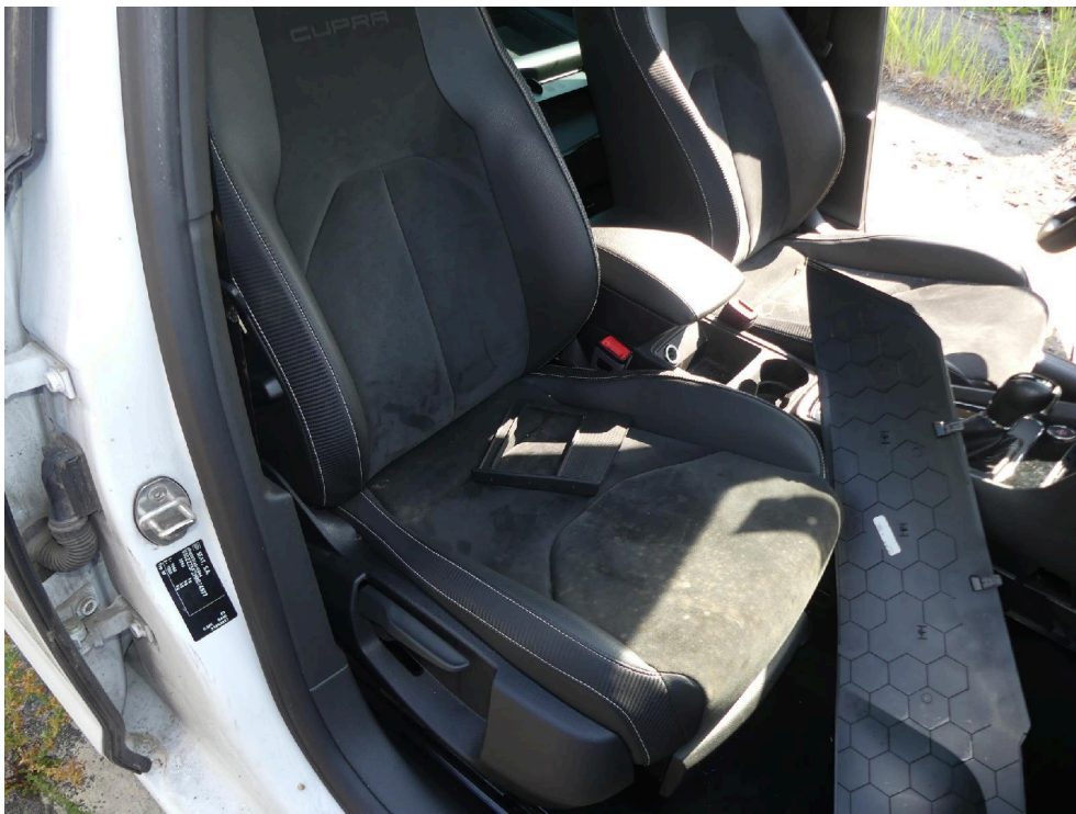
Bild: 36 Einzelansicht Beifahrersitz