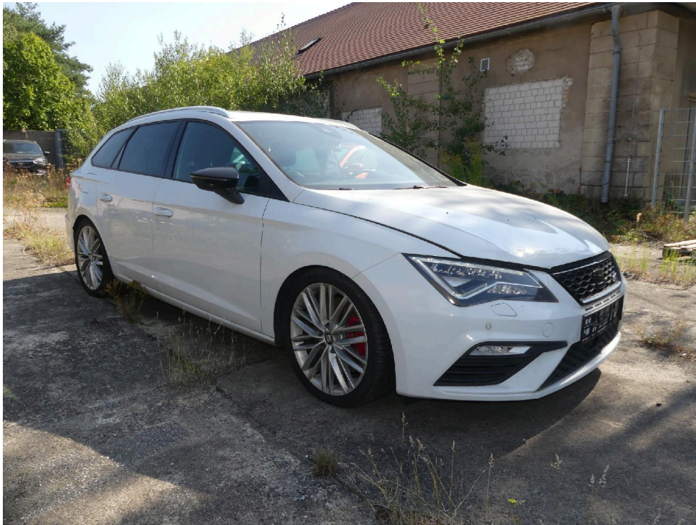
Bild: 1 Diagonalansicht vorn rechts