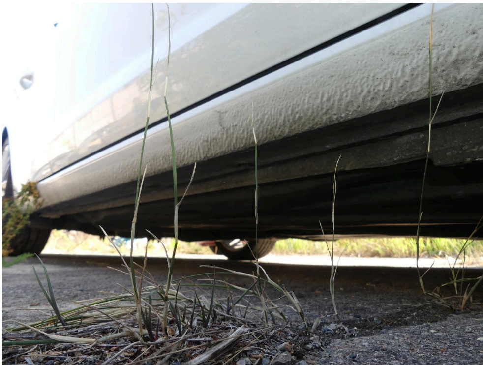
Bild: 40 Ansicht Einstiegsschweller rechts.