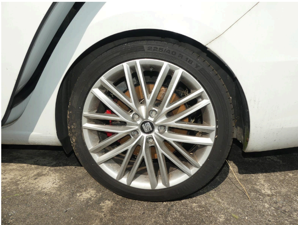
Bild: 50 Ansicht Rad/Reifenkombination hinten links