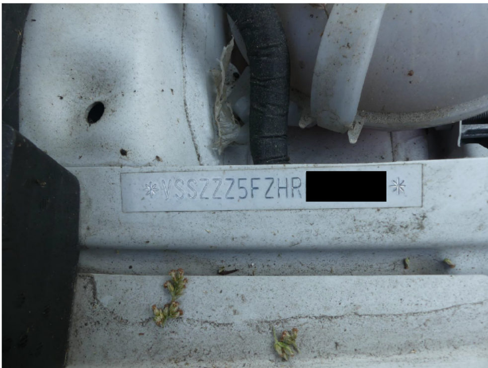
Bild: 38 Ausweisung Fahrzeugidentnummer