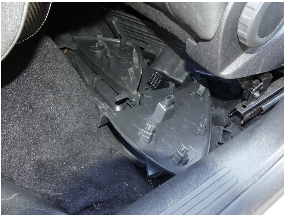
Bild: 32 Diverse Verkleidungselemente sind demontiert und lose im Innenraum.