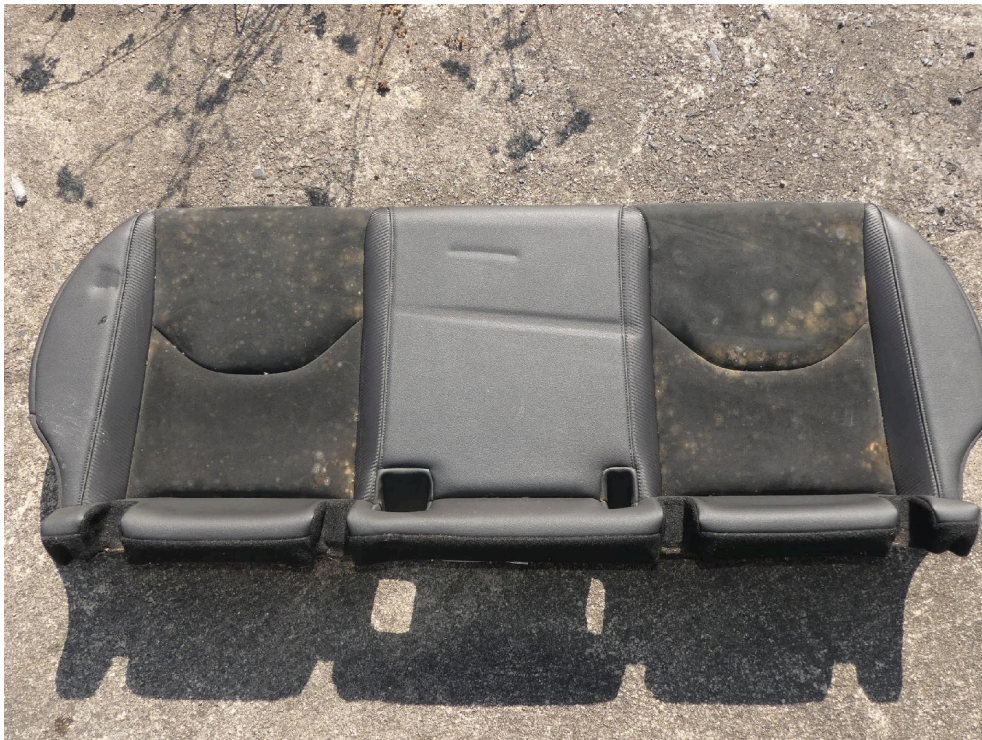
Bild: 24 Übersichtsaufnahme Rücksitzbank mit Schimmelspuren.