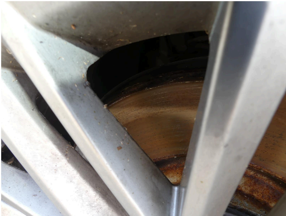
Bild: 48 Standschäden Bremsanlage