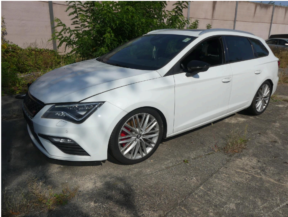
Bild: 3 Diagonalansicht vorn links