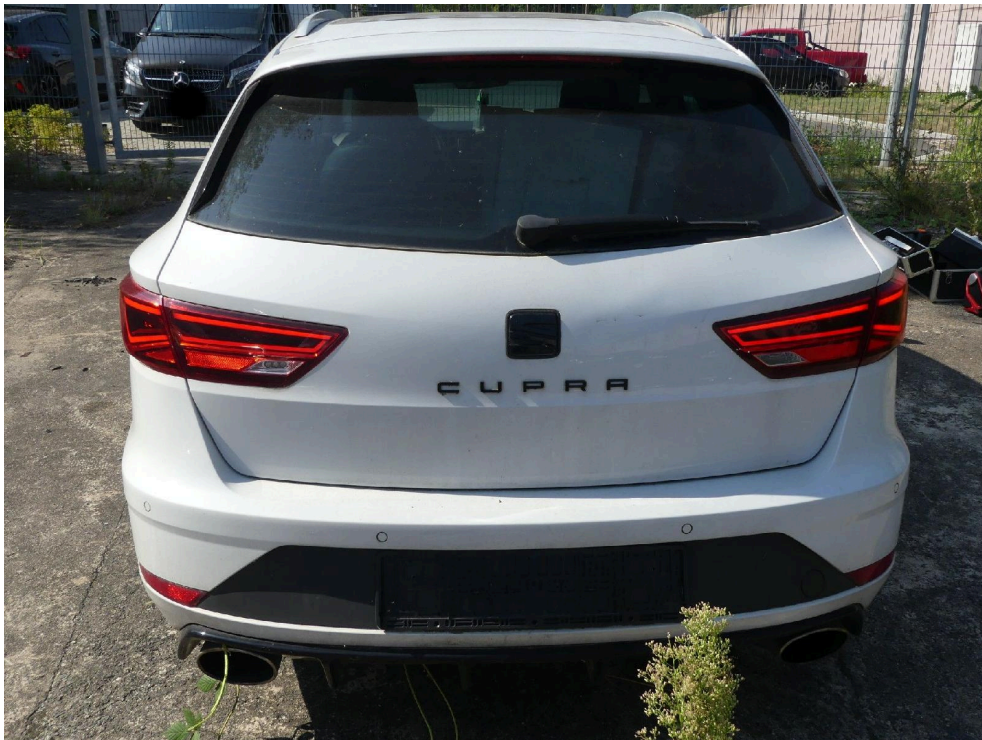
Bild: 6 Heckansicht