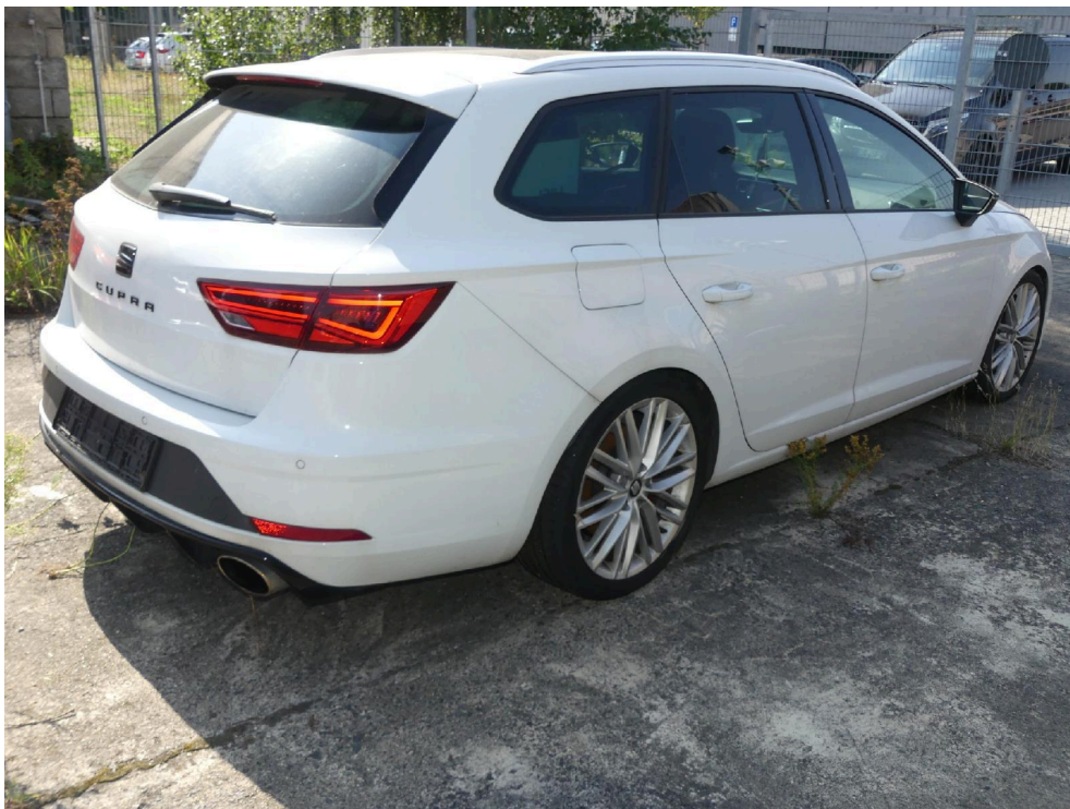
Bild: 4 Diagonalansicht hinten rechts