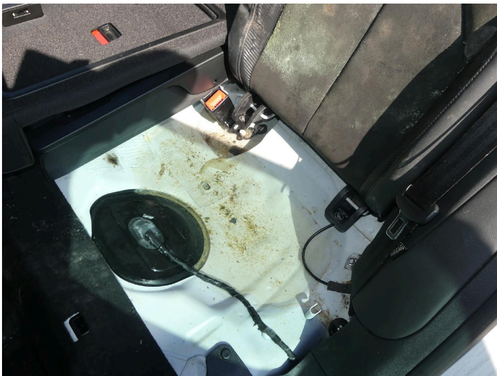
Bild: 26 Wassereintritt im Fondbereich ....