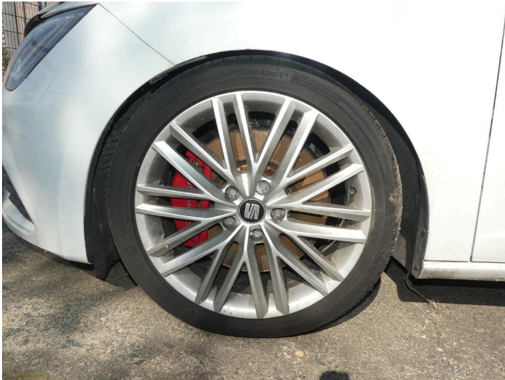
Bild: 49 Ansicht Rad/Reifenkombination vorn links