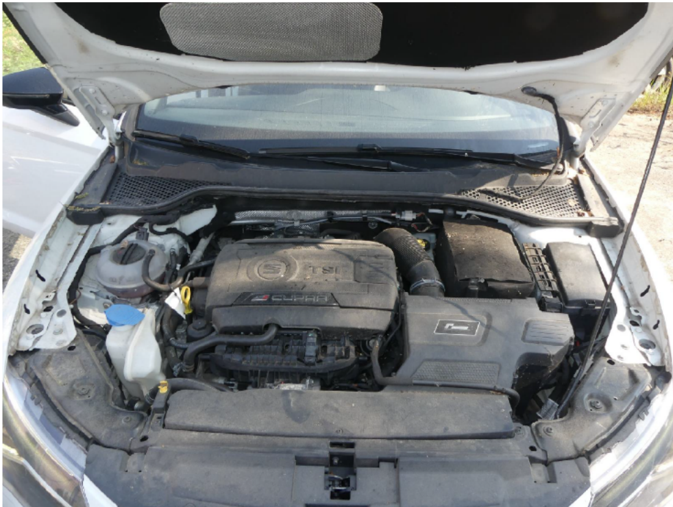
Bild: 37 Ansicht Antriebsaggregat