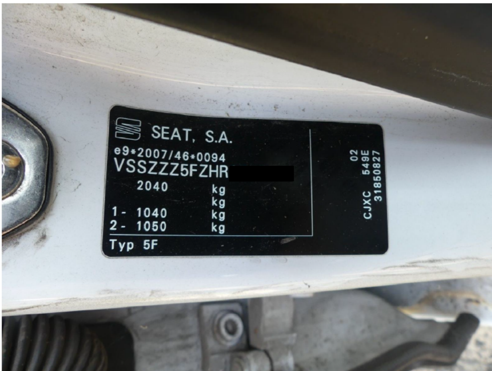
Bild: 10 Ausweisung Fahrzeugidentnummer