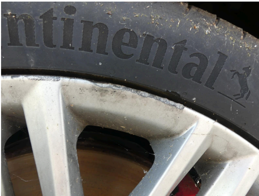
Bild: 44 LM-Felge vorn rechts beschädigt.