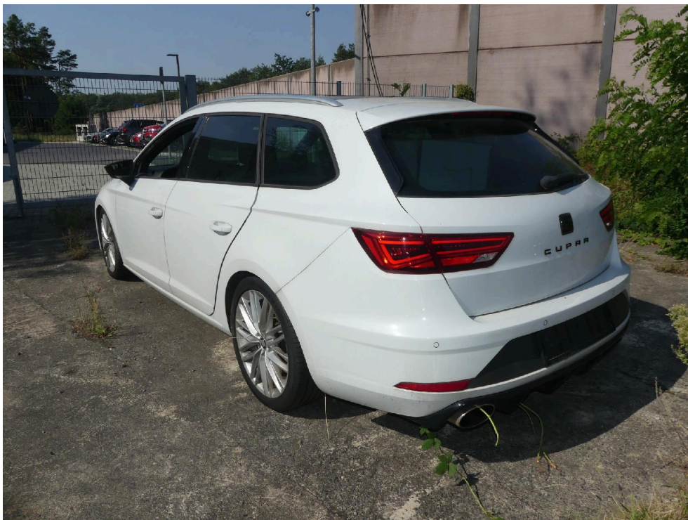
Bild: 2 Diagonalansicht hinten links