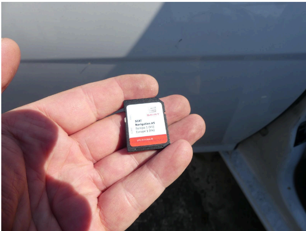
Bild: 20 Speicherkarte Navigationssystem vorhanden.