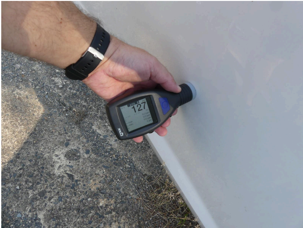
Bild: 55 Ausweisung Lackschichtdickenmessung vorgenommen, Messwerte dem beiliegenden Protokoll entnehmen.