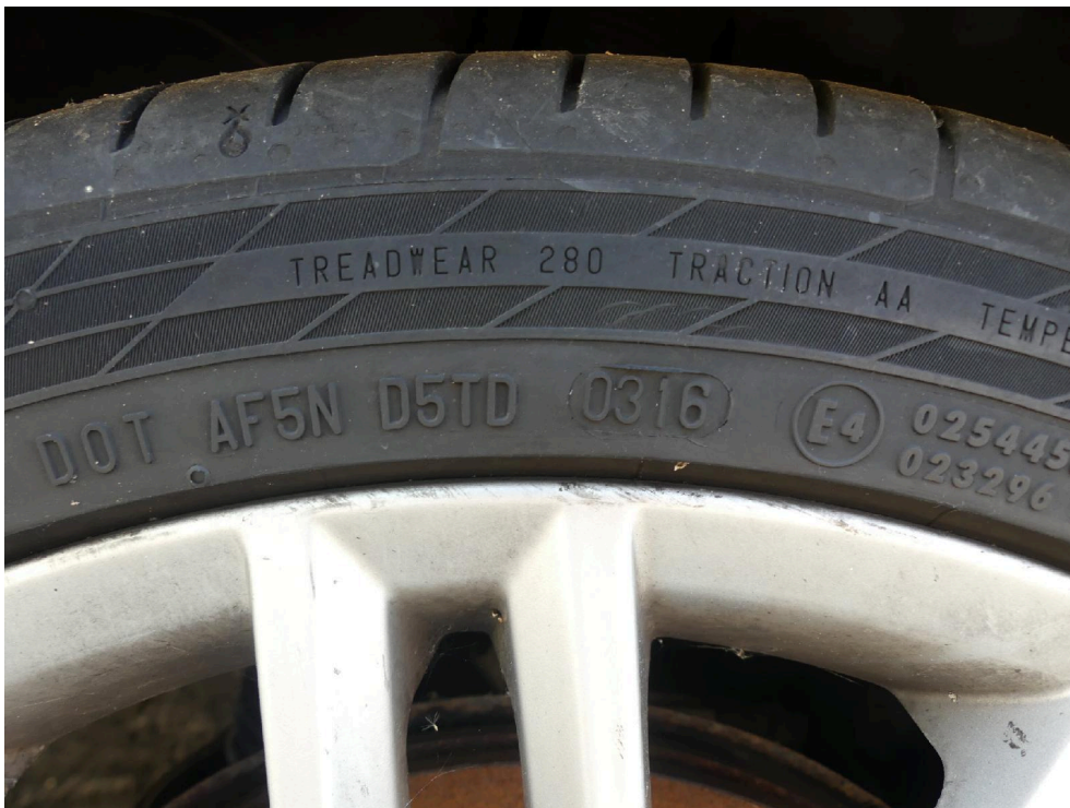
Bild: 42 Ausweisung der DOT Nummer der Radialreifen