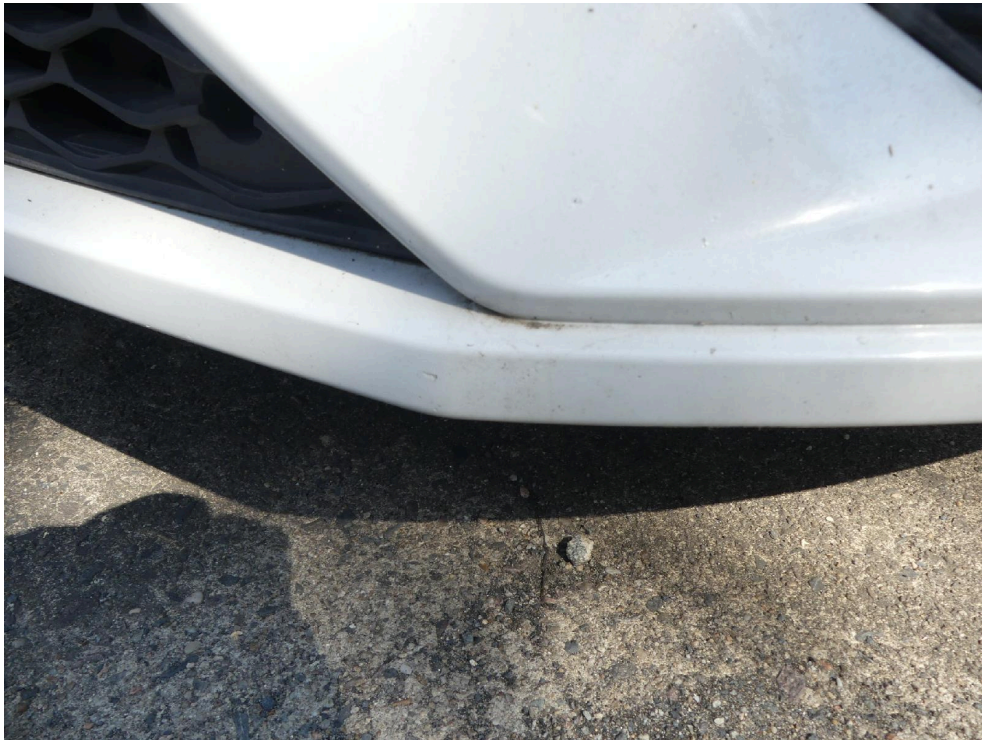
Bild: 51 Detailansicht Frontverkleidung, eine Nachlackierung ist erkennbar.