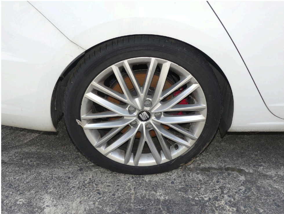
Bild: 41 Ansicht Rad/Reifenkombination hinten rechts