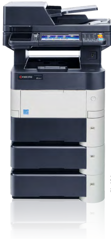
Abb. mit Optionen