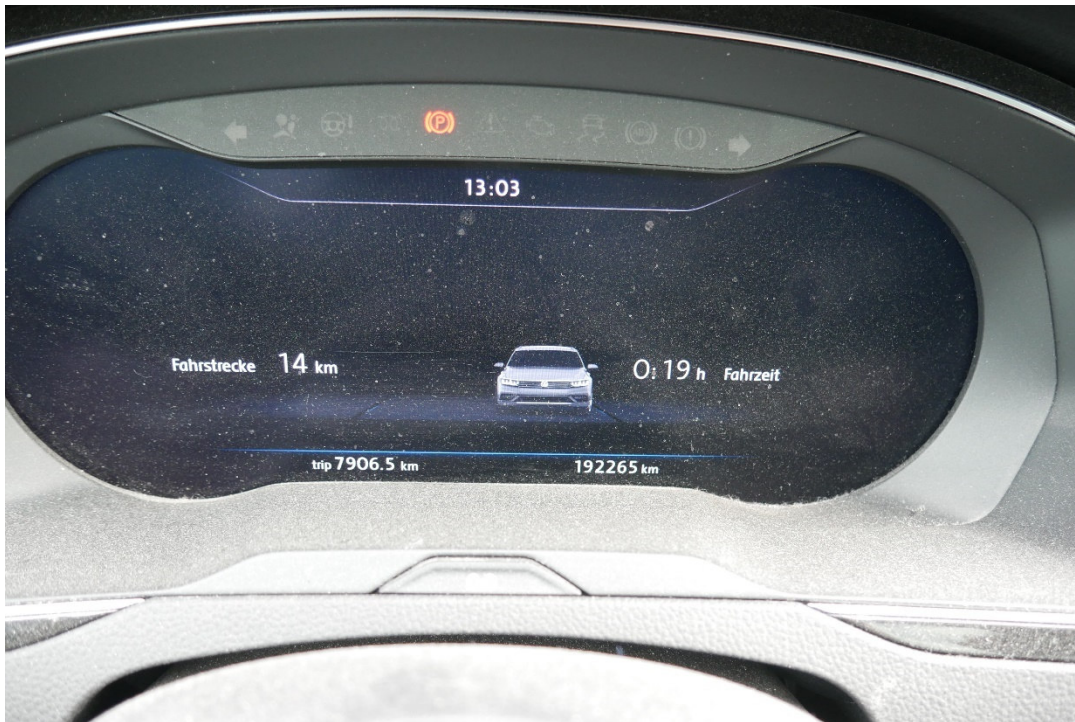
Lichtbild Nr. 15