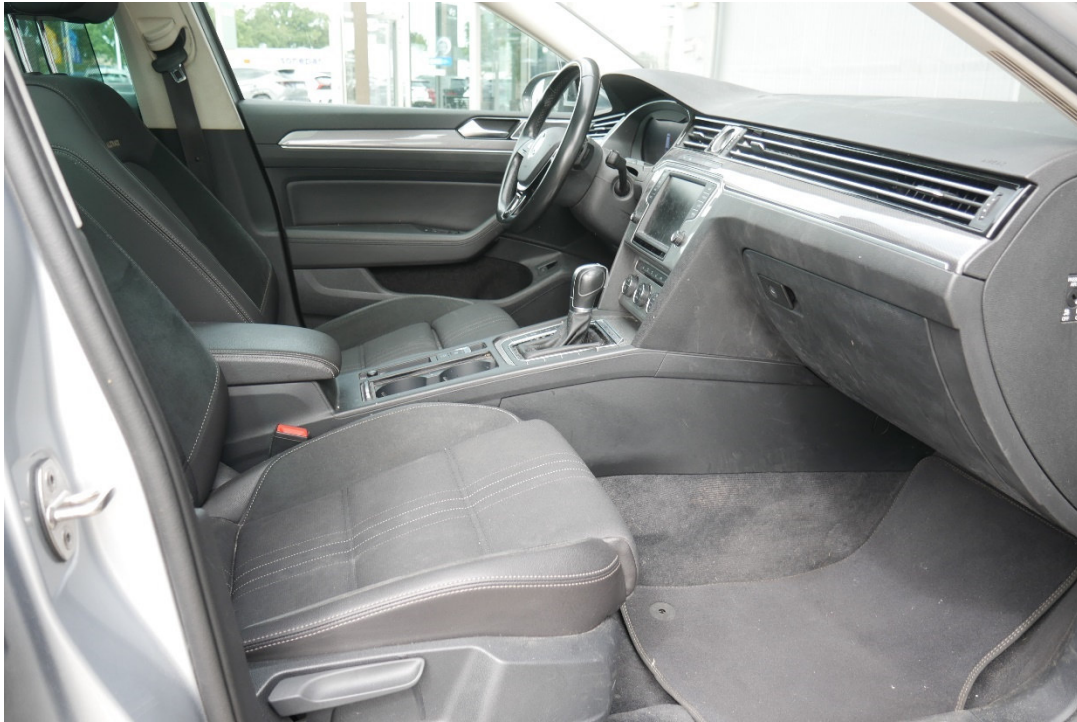
Lichtbild Nr. 11