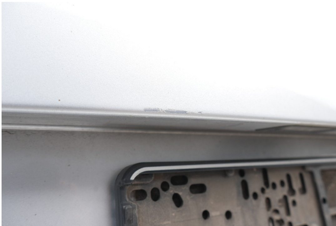
Lichtbild Nr. 8