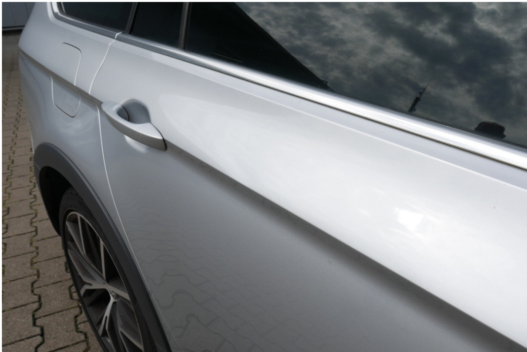
Lichtbild Nr. 6