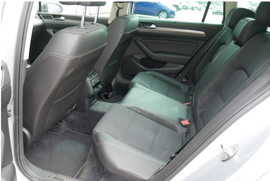
Lichtbild Nr. 10