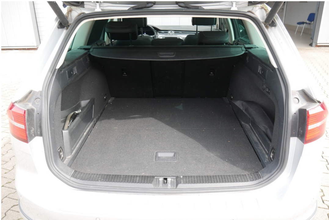
Lichtbild Nr. 14