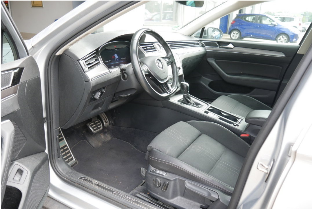
Lichtbild Nr. 9