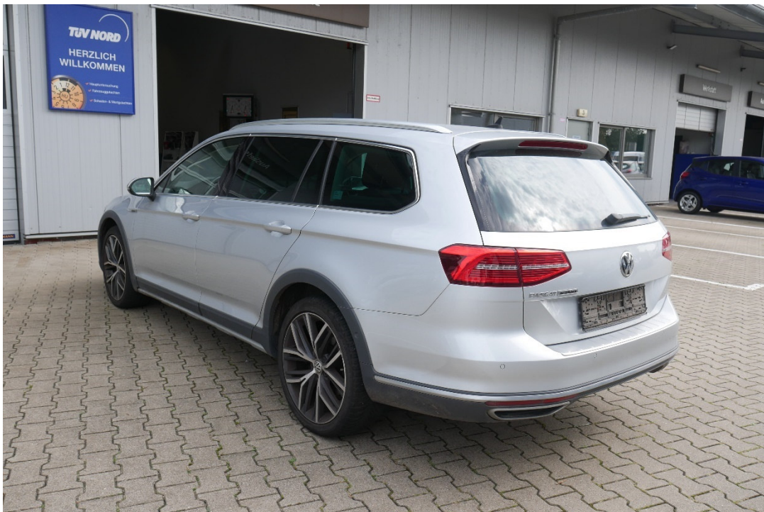
Lichtbild Nr. 4