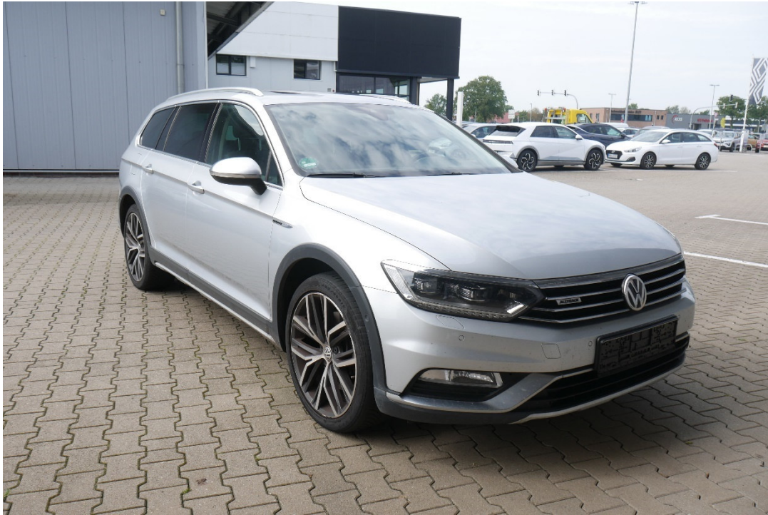
Lichtbild Nr. 3