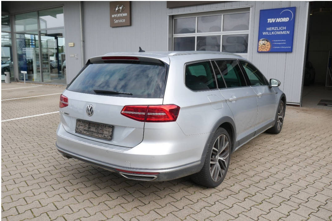
Lichtbild Nr. 2