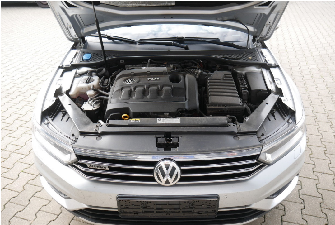
Lichtbild Nr. 13