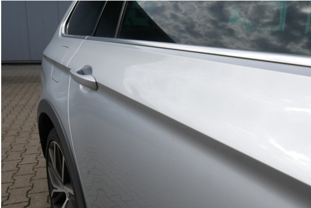
Lichtbild Nr. 5