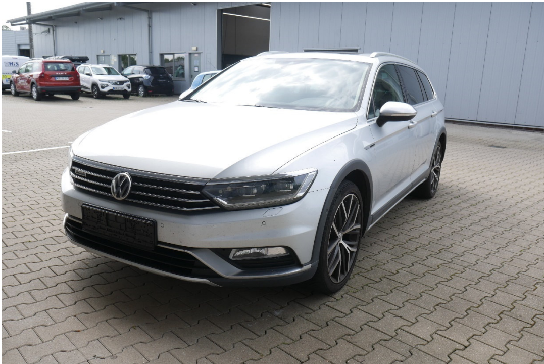
Lichtbild Nr. 1