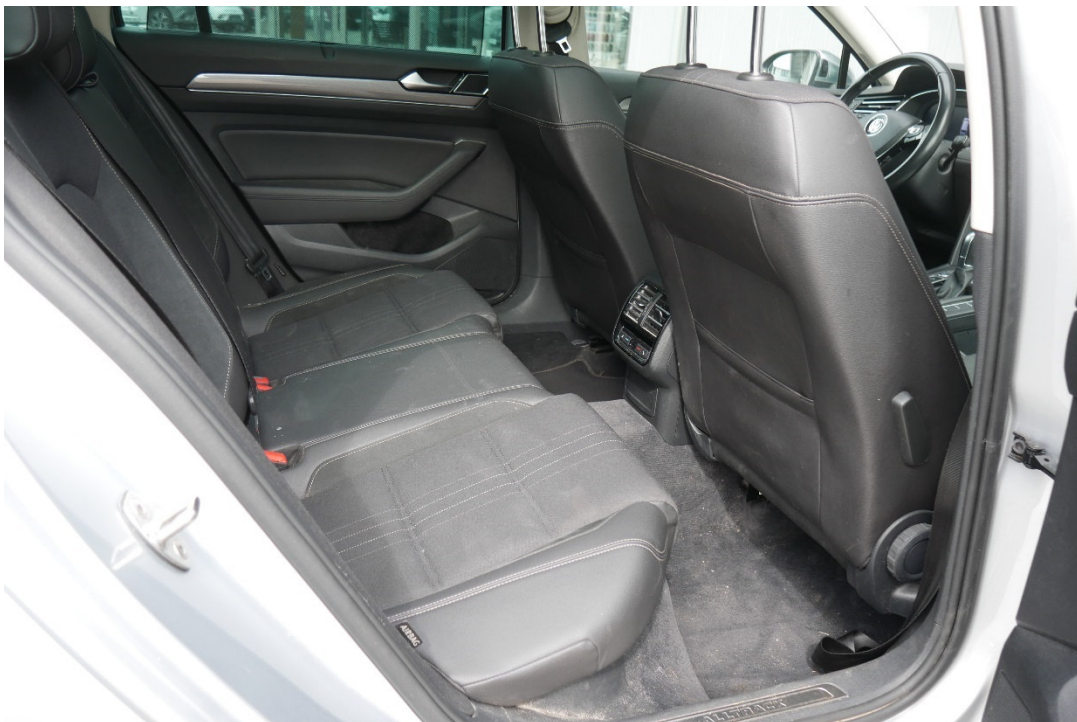
Lichtbild Nr. 12