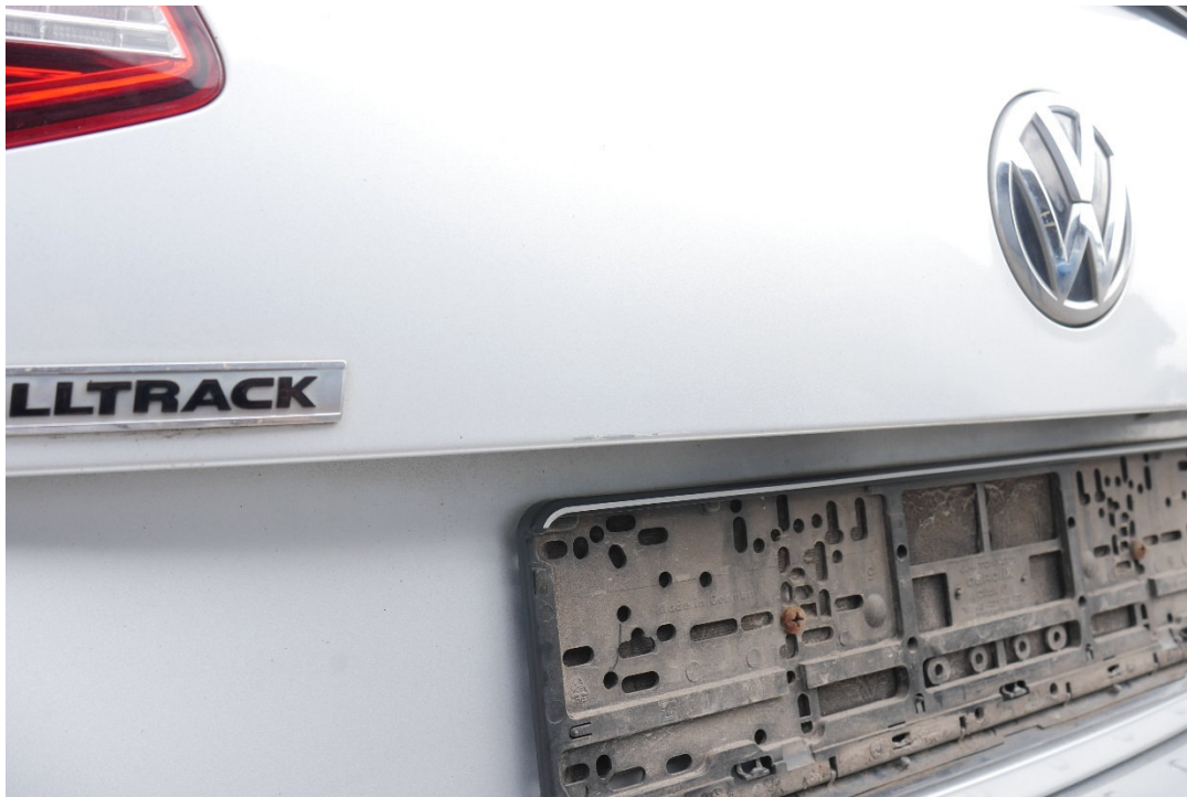
Lichtbild Nr. 7